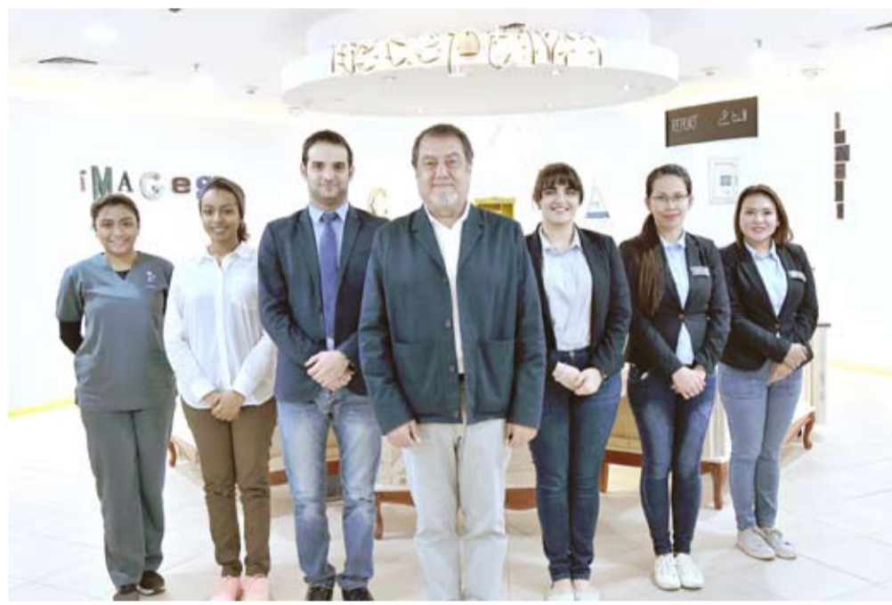
مسؤولو جنرال إلكترونيك

الأطباء على اكتشاف الحالات الخطيرة خلال مراحلها الأولى. وتنتقل دائماً إلى تقديم الحلول المستقبلية لتقنيات التصوير بالرنين المغناطيسي اليوم قبل غد، ولا شك بأن اعتماد المركز لهذه التقنيات سيساهم في إرساء معايير جديدة لتميز خدمات التشخيص على مستوى دولة الكويت.