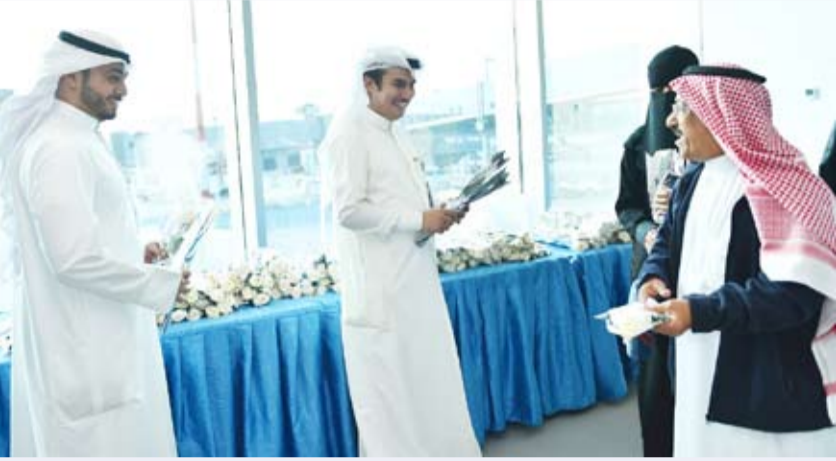
استقبال مواطنين اماراتيين