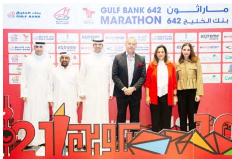
الرئيس التنفيذي مع إدارة الاتصالات في البنك

إلى أنه من أكبر الفعاليات الاجتماعية في الكويت. ندين بالفضل لكل من ساهم بتنظيم هذا اليوم على أكمل وجه، ونخص بالشكر وزارتي الداخلية والصحة، وبلدية الكويت، وهيئة الرياضة، وجميع المتطوعين الذين نثق بتعاونهم الدائم، وننتقل لمشاركتهم نجاح آخر العام المقبل».