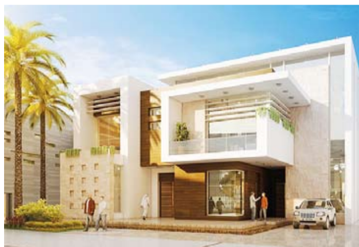
نموذج منزل «موطن الابتكار»