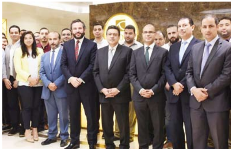
السير القوني خلال زيارته لمقر الشركة في الكويت

بيت الهندسة الكويتي وشركة بيمكو لإدارة المشروعات المتكاملة وشركتي أولد دايموند للأغذية والمشروبات وتجارة التجزئة والدعاية والإعلان والنشر والتوزيع. وقد امتدت شبكة خدماتها محلياً وإقليمياً وبشكل سريع لتشمل مشروعات تتجاوز قيمتها 2 مليار دولار في دول عديدة أهمها: السعودية ومصر وسلطنة عمان وغيرها إلى جانب دولة الكويت، التي تدير فيها مراكز تجارية عديدة أبرزها جيت مول في منطقة العقيلة.