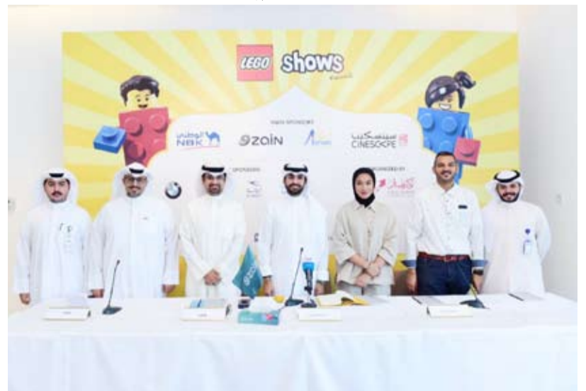
فعاليّة الليغو شونز للمرة الأولى في الكويت

سوف يكون هناك العديد من الماركات الشهيرة المحببة مثل «نينجاغو» Ninjago وذلك وسط أجواء مليئة بالمرح والإثارة ليتمكن مرشدي الفعاليّة من الاستمتاع بالإبتكارات وبناء سيارات مليئة بالتحديات الشيعة. هذا وسوف تتضمن فعاليّة «ليغو شونز» على أكثر من 22 منطقة ترفيهية مليئة بالألشطة والمفاجآت الأخرى وذلك ضمن إطار عائلي ممتع للكبار والأطفال على حد سواء.