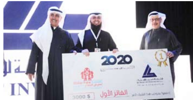
جانب من التكريم

على القطاعات الصناعية والحرفية، والتكنولوجيا، وغيرها، وهو ما يتسق مع شعارنا القائل: «من له حرفة أو صناعة أو فكرة متميزة... لن يضيع»، فالصناعة هي الأساس.