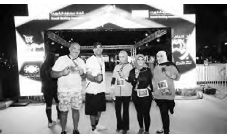
مجموعة من موظفي البنك الأهلي المتحد يشاركون في السباق

سباقاً لدعم الرياضة والإهتمام بنشر الوعي الصحي بين أفراد المجتمع من خلال العديد من المبادرات المتميزة.