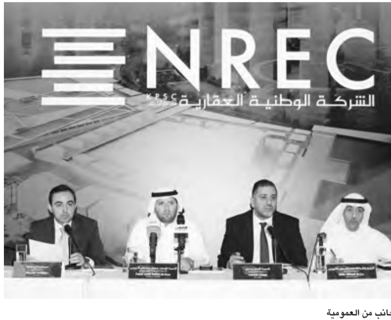
جانب من العمومية

عقدت الشركة الوطنية العقارية اجتماع جمعيتها العامة للسنة المالية المنتهية في 31 ديسمبر 2018، حيث وافق مساهمو الشركة على توصية مجلس الإدارة بتوزيع أسهم منحة مجانية بواقع 10%، كما انتخب المساهمون مجلس الإدارة للسنوات الثلاثة القادمة.