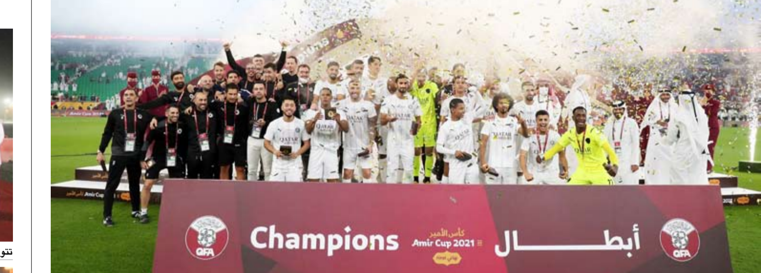
تتويج السد بلقب كأس أمير قطر