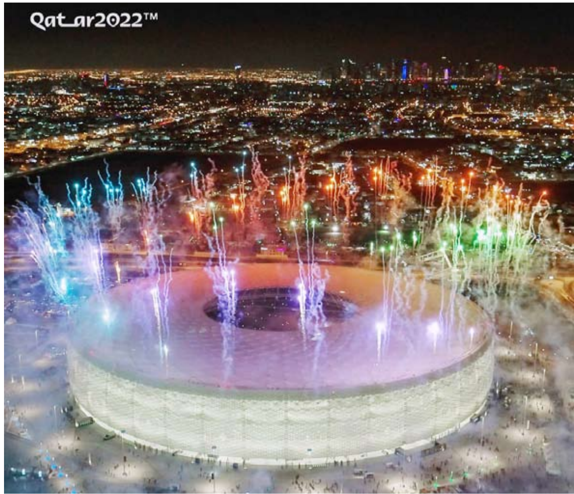
تدشين استاد الغمامة القطري بطريقة مبهره

الكويت لكرة الطائرة بنسخته السابعة لموسم (2021-2022) بعد فوزه على نظيره القادسية بنتيجة (3-0) في المباراة النهائية. وتمكن (الكويت) من حسم المباراة بأول ثلاثة أشواط في مباراة صعبة على الفريقين حيث كان (القادسية) ندا عنيدا طوال أشواط المباراة التي جاءت نتيجتها بواقع (25-22) و (25-19) و (22-22). وشهدت المباراة منافسة قوية بين الفريقين حاول من خلالها (القادسية) العودة الى المباراة في أكثر من شوط إلا أن نالق لاعبي (الكويت) وتركيزهم حتى النهاية كان حاسما في مباراة ممتعة من الطرفين. وتعد (كأس السوبر) بطولة جديدة استحدثها اتحاد