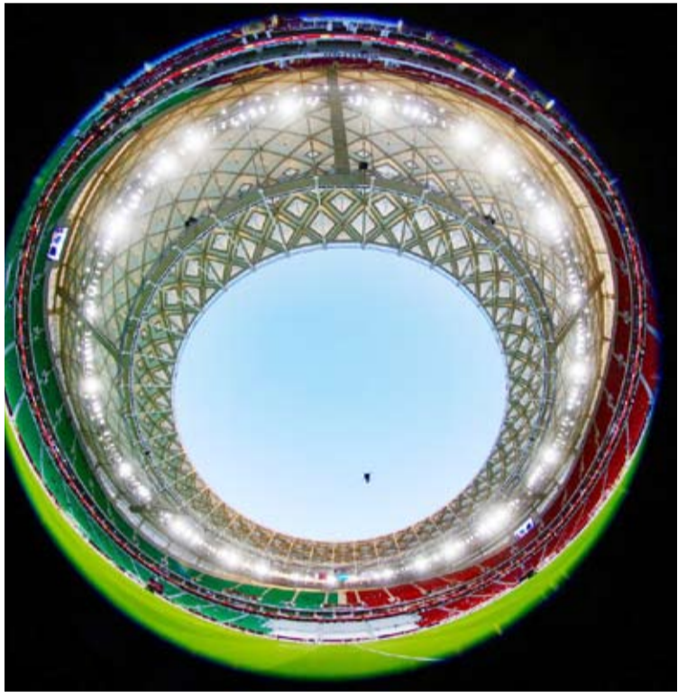
استاد الغمامة في أبهى صورته