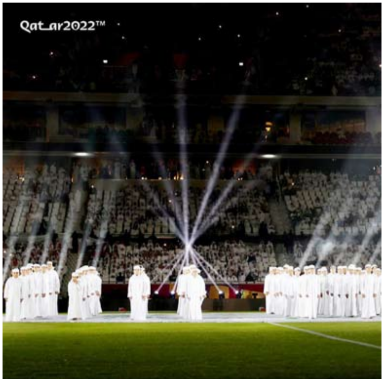
جانب من حفل الافتتاح بالزي القطري