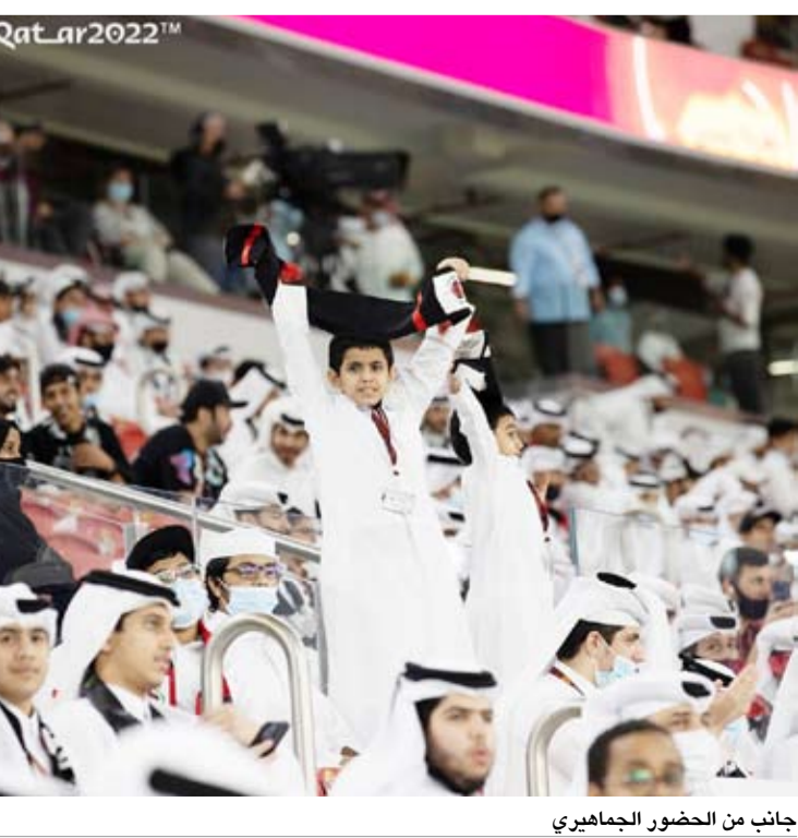
جانب من الحضور الجماهيري

توج نادي السد بلقب كأس أمير قطر لكرة القدم بعد فوزه 5-4 على فريق الريان بركلات الترجيح بعد انتهاء الوقت الأصلي بالتعادل 1-1، في المباراة التي أقيمت الجمعة في افتتاح ملعب الغمامة الذي يستضيف مباريات في كأس العالم العام المقبل. وفي حضور الشيخ تميم بن حمد آل ثاني أمير قطر، سجل الجزائري ياسين براهيمي قائد الريان هدف فريقه الوحيد في الدقيقة 44 من ركلة جزاء، لكن الإسباني سانتني كازورلا أدرك التعادل للسد -حامل اللقب- بالطريقة نفسها في الدقيقة 58، إثر سقوط خوخي بوعلام داخل المنطقة بعد التحام مع المدافع دامي تراوري. وكاد الجزائري بغداد بونجاح أن يفتتح التسجيل للسد بتسديدة أرضية من داخل منطقة الجزاء لكن الكرة مرت إلى خاراج المرمى بعد دقائق من بدء المباراة. وفي الدقيقة 14، أهدر موفق عوض فرصة افتتاح التسجيل