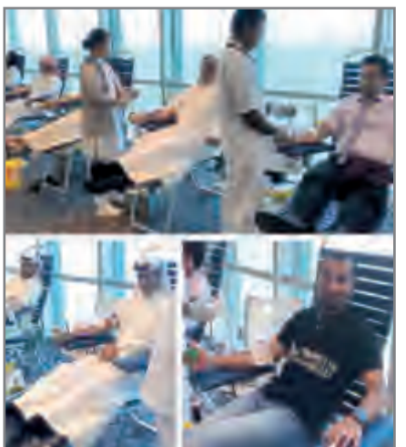
أحدى طائرات الجزيرة

جواً من الوُد والألفة والتعاون، ويساعد على تطوير وإثراء دولة الكويت، وتستثمر VIVA في العلاقة التكافلية ضمن مفهوم العطاء بينها وبين عملائها وبين مختلف شرائح المجتمع، لإيمانها أن العطاء هو جوهر النجاح.