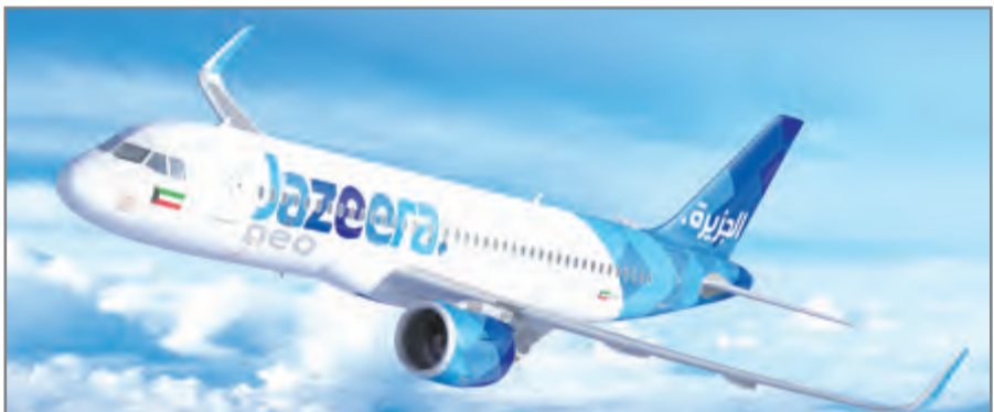
أحدى طائرات الجزيرة