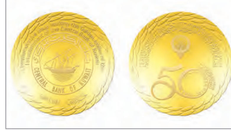
مسكوكة المركزي التذكارية

وأبرز الدكتور محمد يوسف الهاشل المكانة الرفيعة والسعة الرصينة لبنك الكويت المركزي محلياً وإقليمياً وعالمياً مشيداً بالسواعد الوطنية الخلفية بمختلف مواقعها من الذين تعاقبوا في حمل أمانة المسؤولية ليحظى بنك الكويت المركزي بهذه المكانة كمؤسسة اقتصادية اضطلعت وماتزال بالدور الرئيسي في الحفاظ على دعائم الاستقرار النقدي والاستقرار المالي وتعزيز متانة الاقتصاد الوطني، في مسيرة تُكتمل في هذا العام يوبيلها الذهبي، وصانته مركز الدينار الكويتي عملة موقوفة محلياً وبين العملات العالمية على مدى ستة إصدارات متعاقبة لأوراق النقد الكويتية شكّلت على مدى أكثر من نصف قرن من الزمان محطات مهمة في تاريخ النظام النقدي الكويتي. وإلى جانب ذلك تمكّن بنك الكويت المركزي وباقتدار لاقت من تجاوز أصعب التحديات الاقتصادية والمالية المحلية وأعد الأوضاع الإقليمية والأزمات الاقتصادية العالمية، وكان خلال كل ذلك نموذجاً للعمل المؤسسي الرصين.