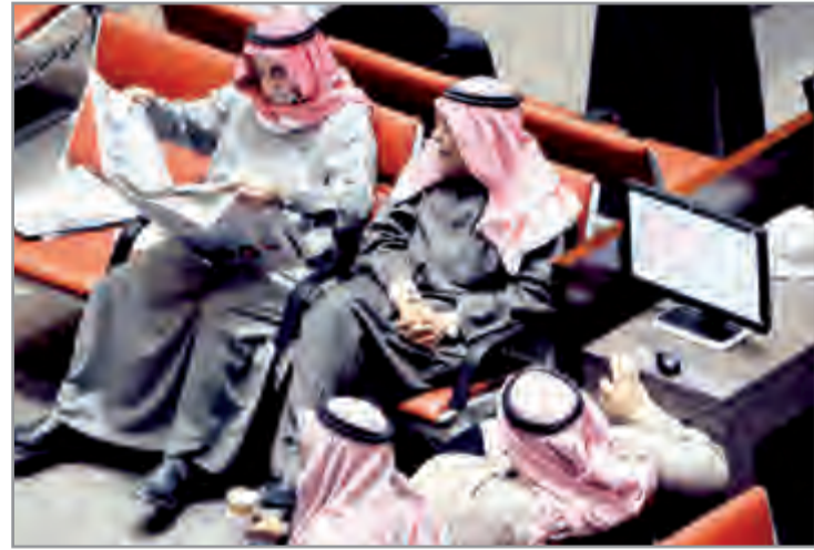
جانب من تداولات البورصة

أنهت بورصة الكويت تعاملاتها أمس الثلاثاء على انخفاض مؤشرها السعري 30ر30 نقطة ليصل إلى مستوى 5ر6680 نقطة بنسبة هبوط بلغت 45ر0 في المقابل انخفض المؤشر الوزني 14ر0ر0 نقطة ليصل إلى 408 نقاط بنسبة انخفاض 0ر03 في حين ارتفع مؤشر (15 كويت) بواقع 86ر086 نقطة ليصل إلى 942ر88 نقطة بنسبة ارتفاع بلغت 0ر09 في المئة. وشهدت الجلسة تداول 64ر5 مليون سهم تمت عبر 2803 صفقات نقدية بقيمة 9 ملايين دينار كويتي (نحو 29ر7 مليون دولار أمريكي).