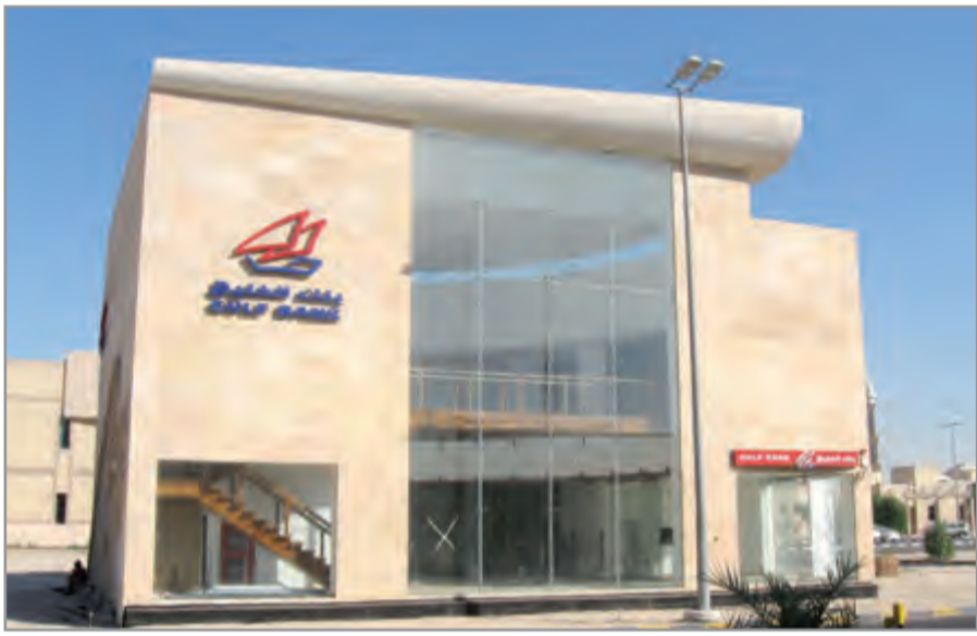
أحد فروع الخليج

على جائزة بقيمة كل منهما 1000 دينار كويتي. سيبدأ السحب الربع سنوي الأول في 28 مارس على جائزة 200.000 دينار كويتي، يليه السحب الربع السنوي الثاني الذي سيجري في 27 يونيو على جائزة 250.000 دينار كويتي ثم السحب ربع السنوي الثالث فسيفام في 26 سبتمبر على جائزة 500.000 دينار كويتي. أما السحب الرابع والأخير فسيكون في 10 يناير 2019 وسيختل هذا السحب تتويج مليونير الدانة لعام 2018 الذي سيحصل على جائزة بقيمة مليون دينار كويتي. ويشجع بنك الخليج عملاء الدانة على زيادة فرص فوزهم عن طريق زيادة المبالغ التي يتم إيداعها في الحساب، مباشرة عبر تحويل المبالغ من أي حساب محلي، بإستخدام خدمة الدفع الإلكتروني الجديدة المتاحة عبر موقع البنك الإلكتروني وتطبيق الهاتف الذكي.