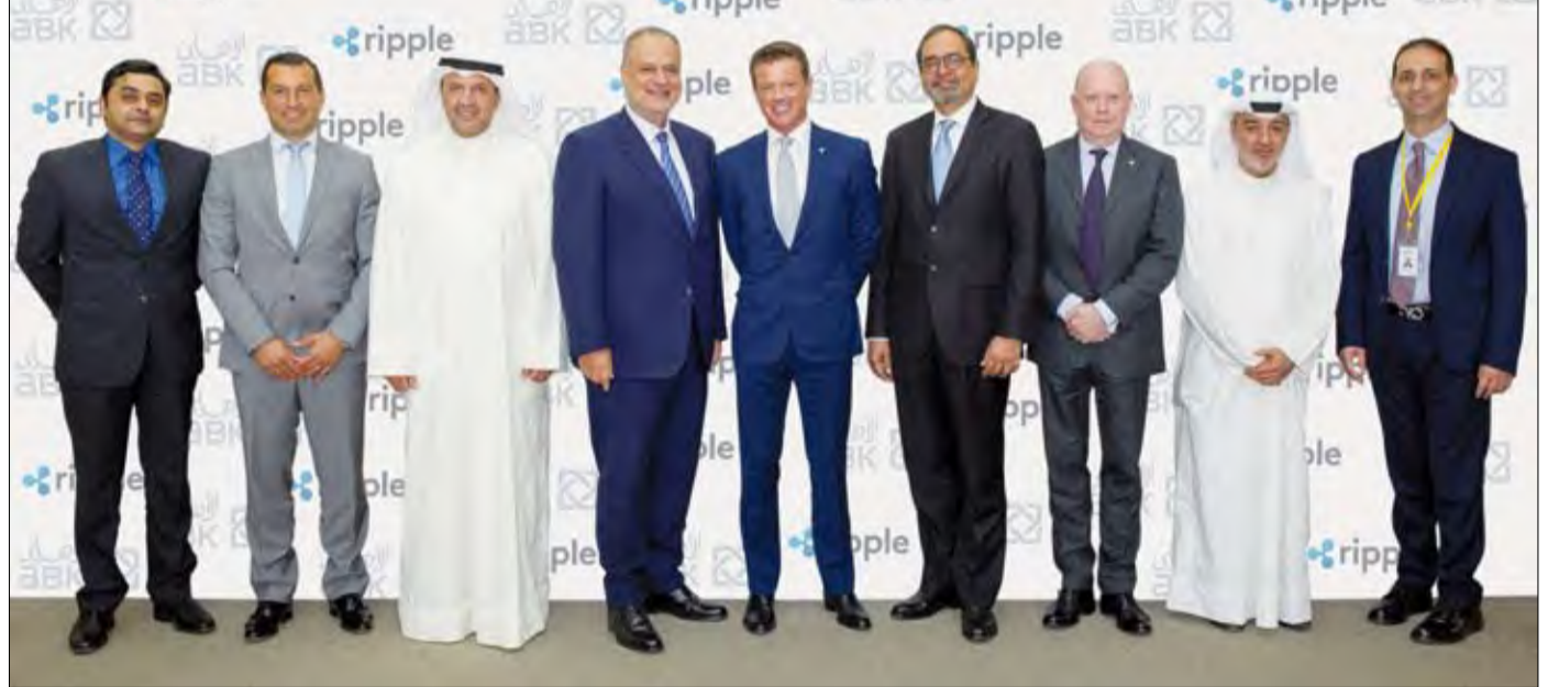
مسؤولو الشركة مع قيادي البنك

هذه الشراكة، سيتمكن عملاء البنك الآن من إرسال الأموال لتقديم العون والدعم إلى عائلاتهم وأصدقائهم وأحبائهم بشكل أسرع وأكثر كفاءة. كما ستتيح هذه الشراكة للبنك الانضمام إلى «ريبل نت - RippleNet»، وهي شبكة عالمية لامركزية من البنوك ومزودي خدمات الدفع. وتهدف هذه الشبكة المتنامية إلى تمكين «قيمة الإنترنت»، مما يسمح للعملاء من مختلف البنوك بتسديد المدفوعات في جميع أنحاء العالم بسرعة مع ضمان الاستلام. ومن شأن هذه الشراكة أن تمكن البنك الأهلي الكويتي من الوصول إلى أعضاء شبكة «ريبل نت»، الآخرين، مما يعزز من قدرته على دفع عجلة نمو أعمال خدمات الدفع العابرة للحدود لديه. وفي معرض تعليقه على هذه الشراكة المتميزة،