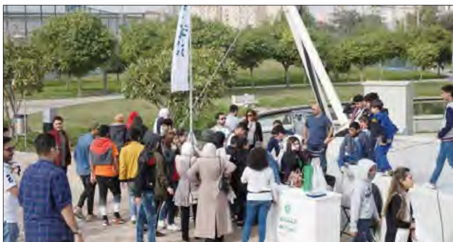
جانب من الحضور

امتنانهم لإدارة التجاري للفعاليات التي ينظمها لهم من وقت لآخر، مشيدين بمزايا حساب @Tijari