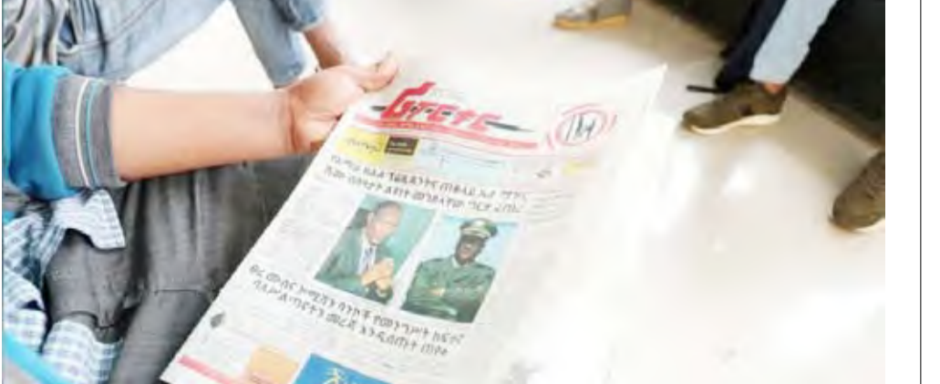
رجل إثيوبي يقرأ صحيفة تحمل صورة أمباتشو مكونن وسيري مكونن

كبيرة أخرى ومسؤولون من الكنيسة الأرثوذكسية. ووقع هجومان منفصلان خلال أعمال العنف وقادهما الجنرال أسامنيو تسجيي قائد الأمن في أمهرة الذي كان يجند المقاتلين علانية للميليشيات العرقية في ولاية أصبحت بؤرة عنف ساخنة. وقال السكرتير الصحفي لرئيس الوزراء لرويترز إن أسامنيو قُتل بالرصاص قرب مدينة بحر دار عاصمة أمهرة. وعلاوة على اغتيالات في العاصمة، قُتل أيضا رئيس ولاية أمهرة أمباتشو مكونن ومستشاره في بحر دار.