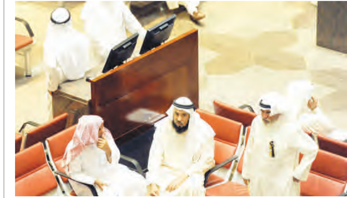
مداولون في البورصة

بنك برقان وإعلان شركة بورصة الكويت عن تنفيذ بيع أوراق مالية (مدرجة وغير مدرجة) لمصلحة حساب إدارة التنفيذ في وزارة العدل.