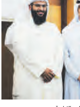
محمد الدولية متوسطا أعضاء من كلية العلوم الادارية

نظم بيت التمويل الكويتي "بيتك" حلقة دراسية حول "مدخل للصكوك" لطلبة كلية العلوم الادارية في جامعة الكويت. تأتي هذه المبادرة استمرارا للعلاقة المتحفزة بين "بيتك" والطلبة في الجامعات، وضمن اطار المسؤولية الاجتماعية للبنك والسعي المتواصل لنشر مفهوم الصيرفة الاسلامية وابرار أهميتها وورها في الاقتصاد العالمي، وكذلك بهدف تعزيز خبرة الطلاب وأشراف الخبيرات التعليمية من خلال إتاحة الفرص التعليمية والتدريبية.