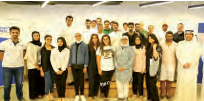
لقطة جماعية للمشاركين في الحملة

يشارك بنك الكويت الوطني في الحملة البيئية العالمية Clean Up the World المدعومة من قبل برنامج الأمم المتحدة للبيئة والتي تقوم حركة «موطني» MW6INY البيئية التطوعية بتنظيمها في الكويت بمشاركة نحو 20 جهة محلية. وستقوم الجهات المشاركة من الكويت بحملات بيئية متفرقة تشمل مختلف المناطق والواجهة البحرية تحت إشراف الحملة