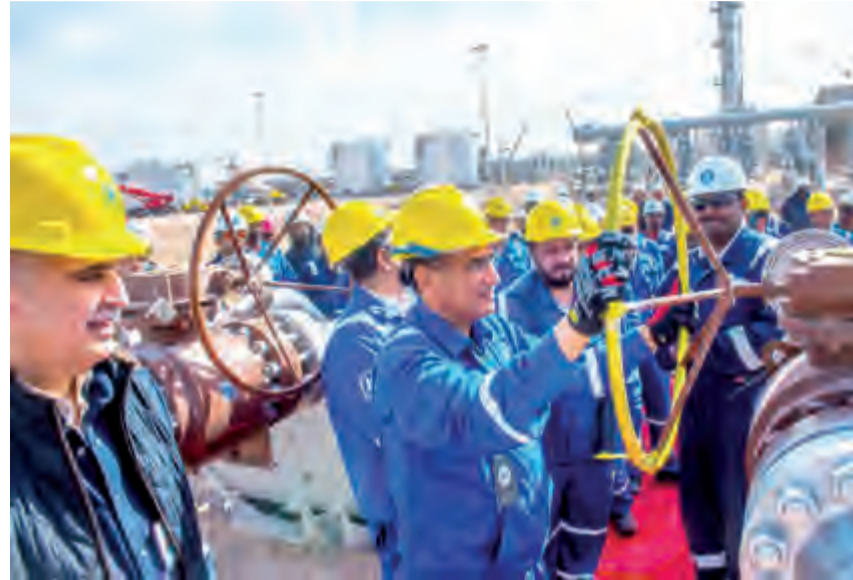
وزير النفط خلال جولة تفقدية