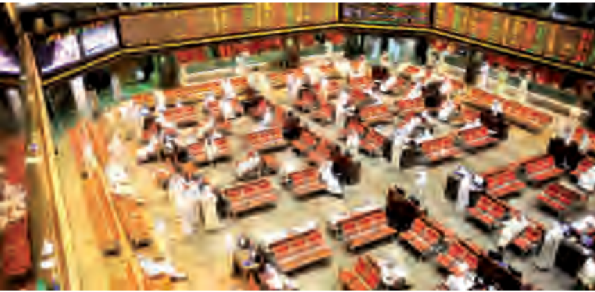
جانب من تداولات البورصة

انتهت بورصة الكويت تعاملاتها أمس الثلاثاء على انخفاض المؤشر العام 2.93 نقطة ليبلغ مستوى 5129.4 نقطة بنسبة انخفاض 0.06 في المئة. وبلغت كميات تداولات المؤشر 63.5 مليون سهم تمت من خلال 4520 صفقة نقدية بقيمة 19.7 مليون دينار كويتي (نحو 65 مليون دولار أمريكي). وارتفع مؤشر السوق الرئيسي 4.03 نقطة ليصل إلى مستوى 11.174.84 نقطة وبنسبة ارتفاع 0.08 في المئة من خلال كمية أسهم بلغت 31 مليون سهم تمت عبر 1450 صفقة نقدية بقيمة 2.6 مليون دينار (نحو 8.5 مليون دولار). وانخفض مؤشر السوق الأول 6.77 نقطة ليصل إلى مستوى 5339.18 نقطة وبنسبة انخفاض