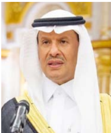
الأمير عبد العزيز بن سلمان

مضافة للاقتصاد الوطني، وما سيفرعه من إمكانيات مالية كانت تذهب هدرًا، مشيرًا إلى أن "منظومة الطاقة قامت بجهد كبير خلال العام الماضي لإعادة الاستقرار للأسواق النفطية".