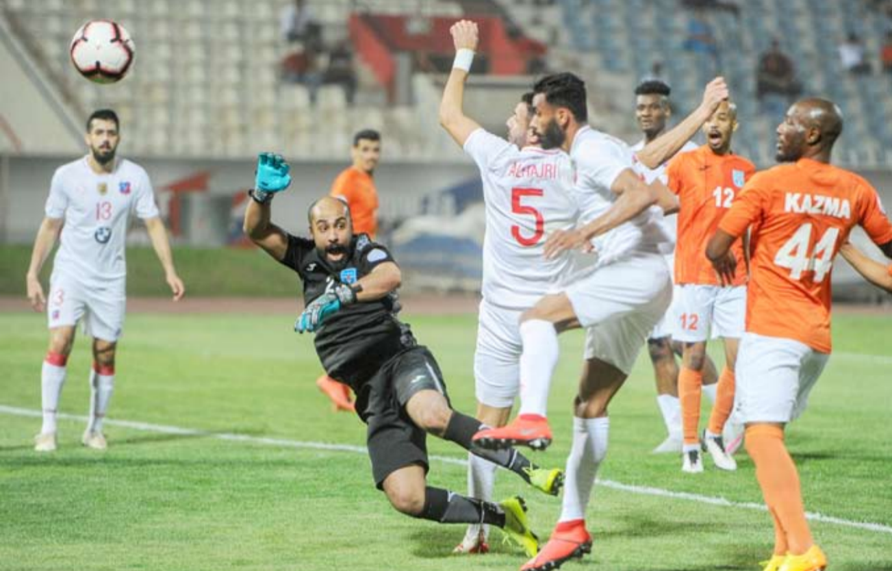
لقطة من مواجهة سابقة بين كاظمة والكويت