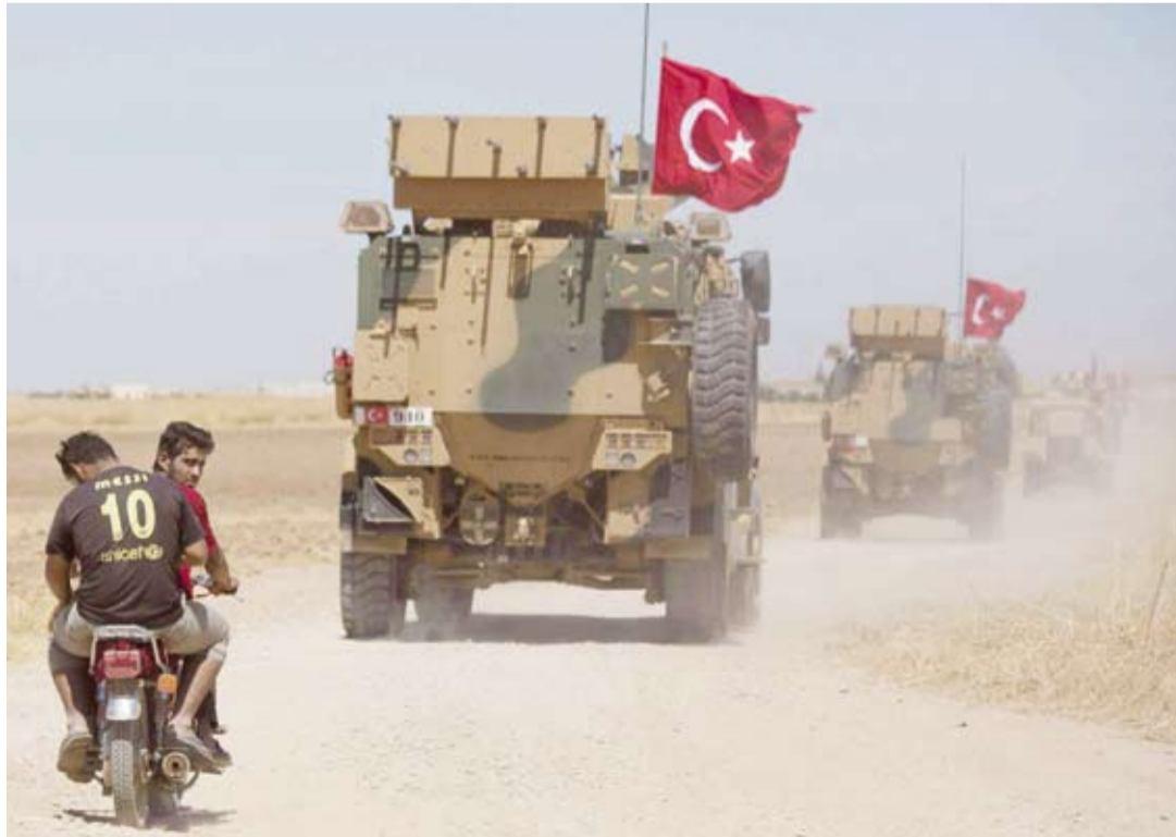
قوات تركية في سورية

"درع الربيع"، وتمت حياة مفعمة بالصحة والسعادة للذين أصيبوا خلالها. وأوضحت أن العملية استهدفت منع توسع النظام وضمان أمن القوات التركية في المنطقة. كما أنها حالت دون حدوث موجة هجرة نحو الحدود التركية بسبب هجمات النظام. واستهدفت العملية ضمان أمن السكان في المنطقة وعودتهم إلى ديارهم بطريقة آمنة وطوعية