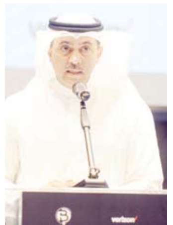
سالم الأذينة متحدثاً

أكد رئيس الهيئة العامة للاتصالات وتقنية المعلومات الكويتية سالم الأذينة سعي الهيئة لتعزيز مستوى جهوزية الأمن السيبراني لحماية اقتصاد الدولة