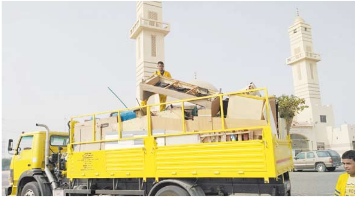
بدء عمليات التنظيف في المحافظات الست