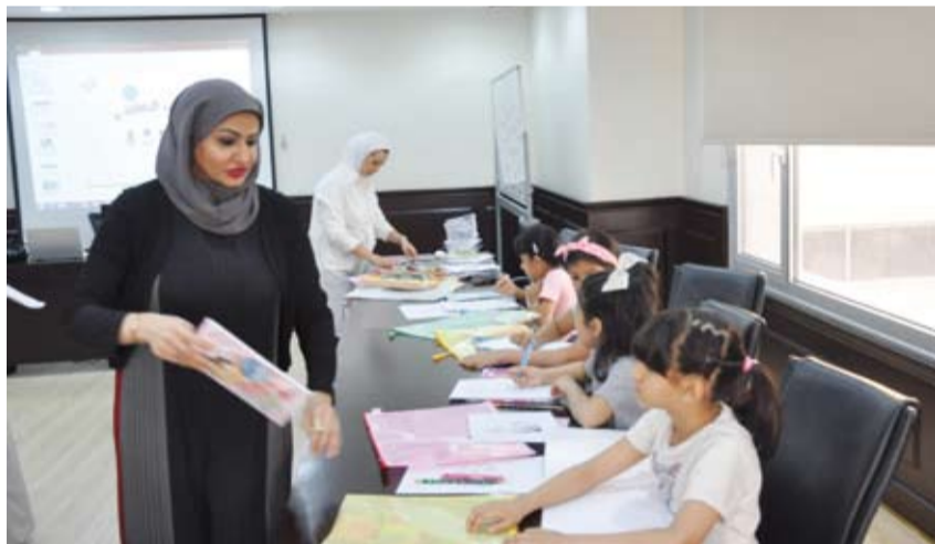
الكندي ومتابعة لتدريب الأطفال على القراءة والمهارات