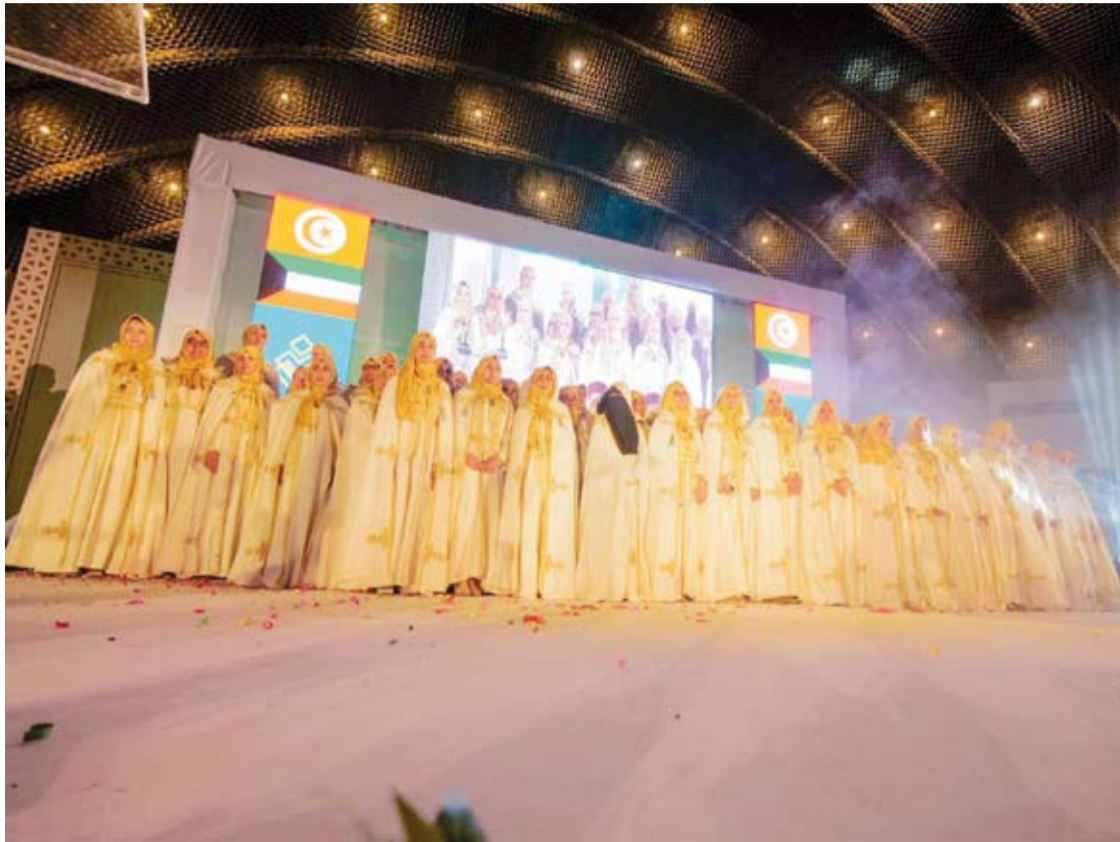
لقطة جماعية للمشاركات