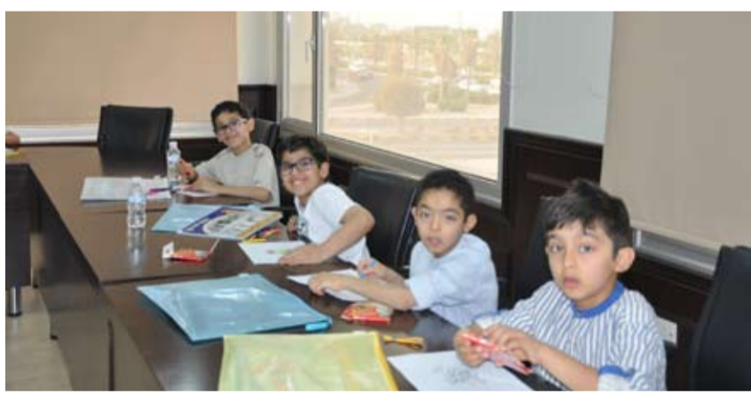
مجموعة من الأطفال خلال تمارين المهارات

إلى غرس حب القراءة في نفس الطفل وجعل القراءة ممتعة له، وتوسيع إدراكه وتنمية شخصيته من خلال المناقشة والحوار وتشجيعه على التعبير عن رأيه بثقة، بالإضافة إلى أننا حققنا منصوبنا إليه من تنمية مهارات أخرى للأطفال مثل فهم النص المقروء وربطه بالحياة اليومية مع التدريب على التطبيقات العملية، وتنمية مهارة الاستقلالية في القراءة.