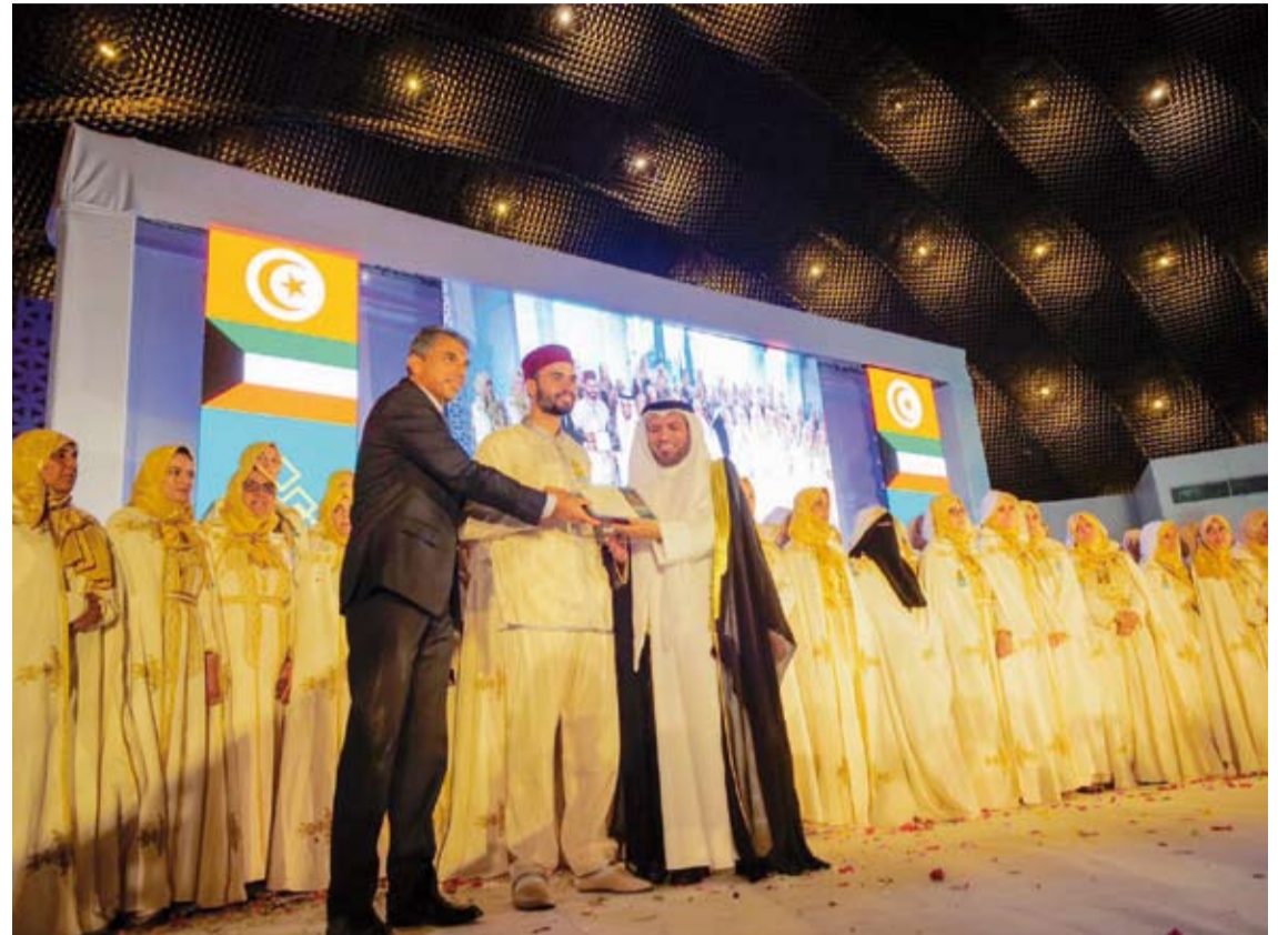
جانب من حفل تخريج حفظة القرآن الكريم ضمن مشروع الشفيح

ويهدف مشروع (الشفيح) لتحفيظ القرآن الكريم للهيئة الخيرية الإسلامية العالمية التي أطلقتها الهيئة الخيرية الإسلامية العالمية في تونس. جاء ذلك في حفل أقامه المشروع بالتعاون مع جمعية (مرحمة) للمشاركة الخيرية والاجتماعية التونسية حضره