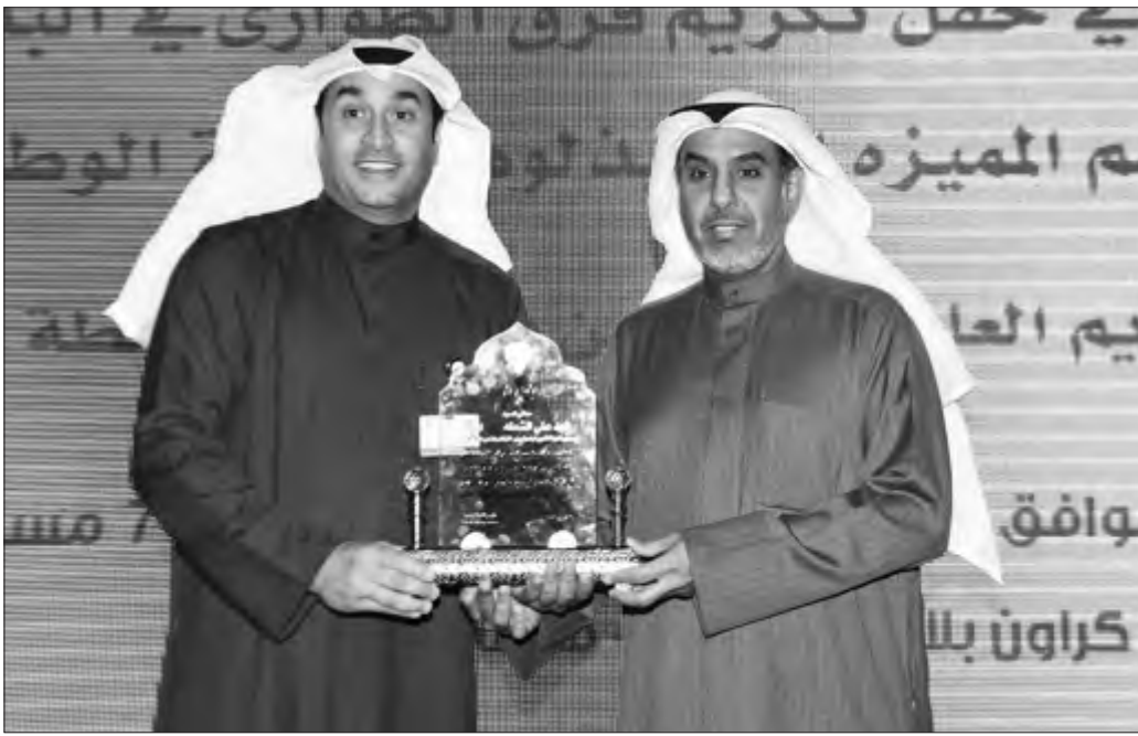
العرادة يقدم درعاً للوزير الشعلة

أصبحت عنصراً لا غنى عنه في المنظومة الرقابية بالبلدية. ونظراً للحوية التي تتمتع بها هذه الكفاءات والعناصر الكويتية في مختلف مجالات البلدية، وبالتالى فإنه أصبحت تشكل نسيجاً متكاملاً ومتناسقاً، فهي تمثل كافة إدارات البلدية، ومن هنا فإن وجودها ضروري. وأكد العرادة أن النقابة تشجع دائماً هذه الكفاءات الوطنية وتقف معها وتمد لها يد العون، وكما نفخر أن حملة حافز مستمرة للعام الرابع على التوالي وهي أطول حملة تكريم في تاريخ العمل النقابي كما يسر حافز أن تكريم المزيد مستقبلاً من العاملين المميزين وكل مجتمع ومخلص في البلدية، كما نؤكد أن النقابة حريصة كل الحرص على رعاية مصالح العاملين والدفاع عن حقوقهم والعمل على تحسين حالتهم المادية والاجتماعية وإبوابها مفتوحة لجميع العاملين لتلقي الآراء والاقتراحات والأفكار البناءة والمطالب العمالية العادلة.