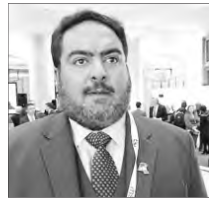
الشيخ ثامر العلي

أكد رئيس جهاز الأمن الوطني الشيخ ثامر العلي أمس أنه لا بديل عن الحوار من أجل التصدي للتحديات والمخاطر الأمنية التي يواجهها العالم. جاء ذلك في تصريح أدلى به الشيخ ثامر العلي لـ (كويتا) على هامش ترؤسه وفد الكويت في أعمال الدورة الـ 55 لمؤتمر ميونخ للأمن إلى جانب مشاركة عشرات من رؤساء الدول والحكومات ووزراء الخارجية والدفاع والمسؤولين الأمنيين والعسكريين. وقال الشيخ ثامر العلي إن المؤتمر ناقش في غضون ثلاثة أيام وجهات النظر المختلفة حيال التحديات الأمنية التي يواجهها العالم وسبل واليات التصدي لها. وأضاف أن المؤتمر بحث كذلك الأزمات التي تشهدا منطقة الشرق الأوسط وقضايا الحد من التسليح ومكافحة الإرهاب وعدا من النزاعات والصراعات التي تهدد الأمن والسلام الدوليين ويكون لها تداعيات انسانية كارثية.