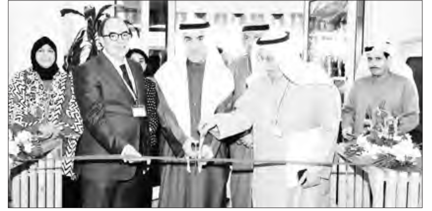
د. حسين الأنصاري يفتتح المعرض

أكد مدير جامعة الكويت الدكتور حسين الأنصاري أن طلبة العمارة مستقبلاً باهراً في سوق العمل وأن لديهم فرصاً في جميع الجهات الحكومية والأهلية. جاء ذلك في تصريح صحفي للدكتور الأنصاري على هامش افتتاح معرض الفرص الوظيفية الأول في كلية العمارة أمس والمقام تحت رعايته خلال الفترة من 17 إلى 19 فبراير الحالي بمشاركة 23 جهة حكومية وأهلية.