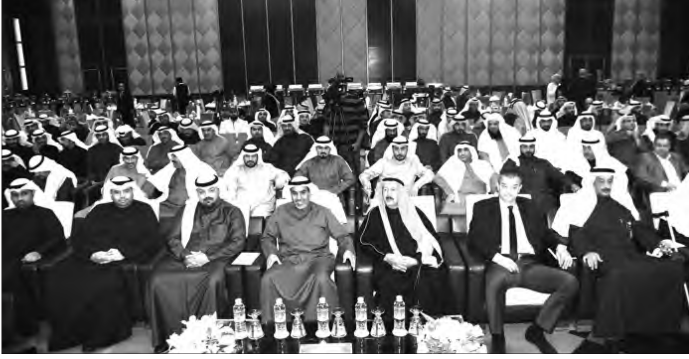
الوزير فهد الشعلة يتقدم الحضور