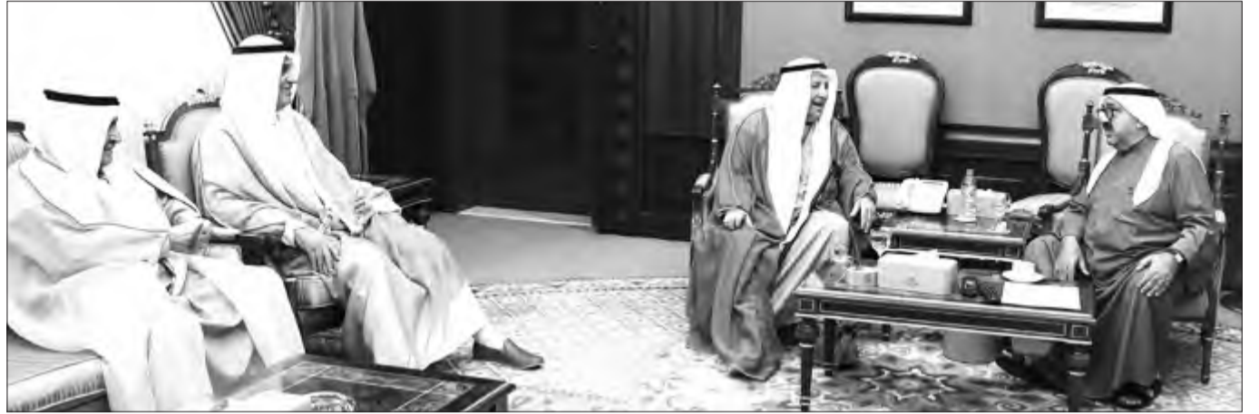
الشيخ ناصر صباح الأحمد يستقبل علي الغانم

كما استقبل النائب الأول لرئيس مجلس الوزراء ووزير الدفاع الشيخ ناصر صباح الأحمد أمس، رئيس غرفة تجارة وصناعة الكويت علي الغانم والوفد المرافق له. حيث تم خلال اللقاء تبادل الأحاديث الودية ومناقشة أهم الأمور والمواضيع ذات الاهتمام المشترك وبحث الجوانب المتعلقة ضمن محور الزيارة.