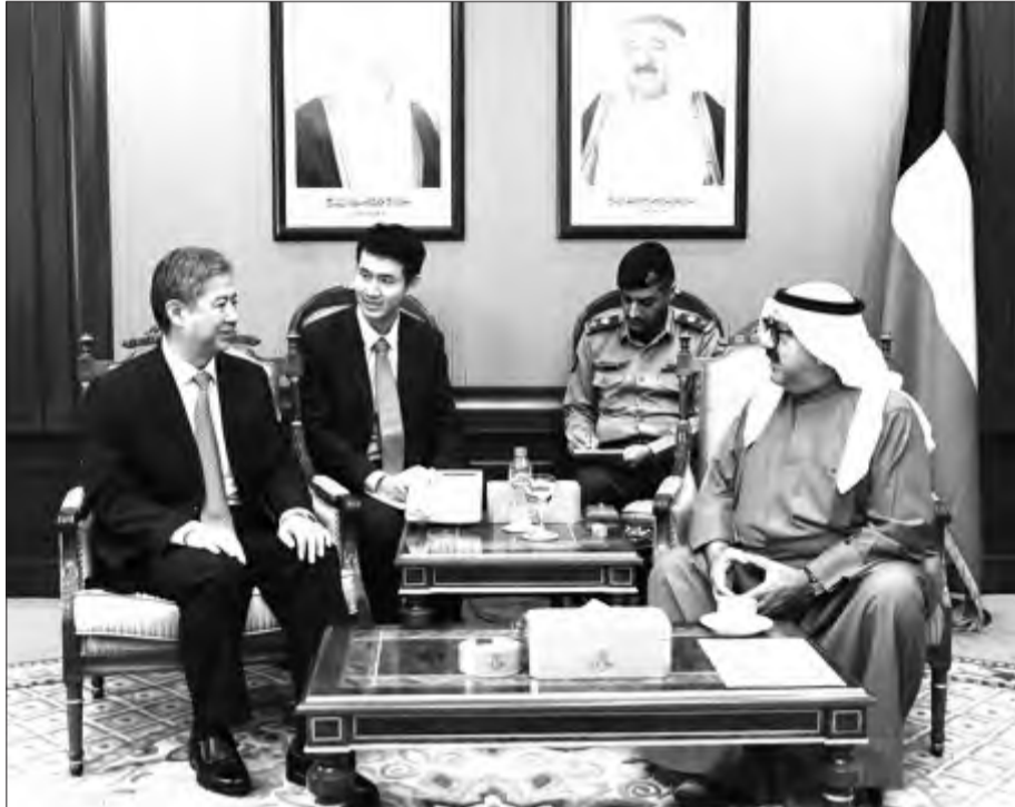
... ويستقبل شيوي تشان بينسينور