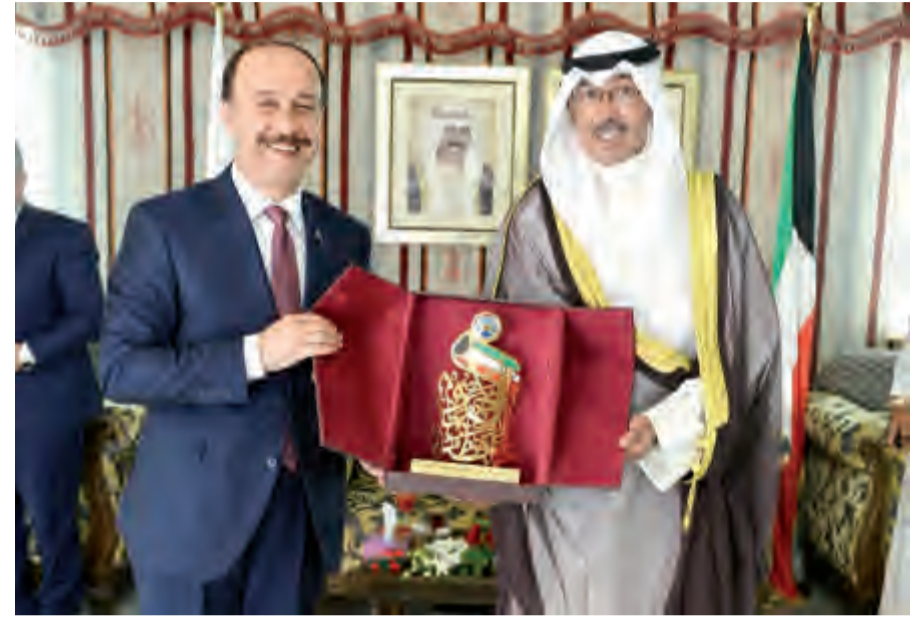
دعوات تذكارية من الخالد إلى حاكم ولاية أورفا

المناخية والإمطار الاستثنائية التي تعرضت لها البلاد وكانت محافظة الأحمدية الأكثر كثافة في التعرض لها وتضرراً منها، كما تم التداول بشأن اليه العمل وتوزيع الأدوار في الأيام القادمة على ضوء توقعات الأرصاد الجوية بموجة قادمة من الأمطار بالغة الشدة ستعرض لها البلاد مجدداً اعتباراً من اليوم الأربعاء .