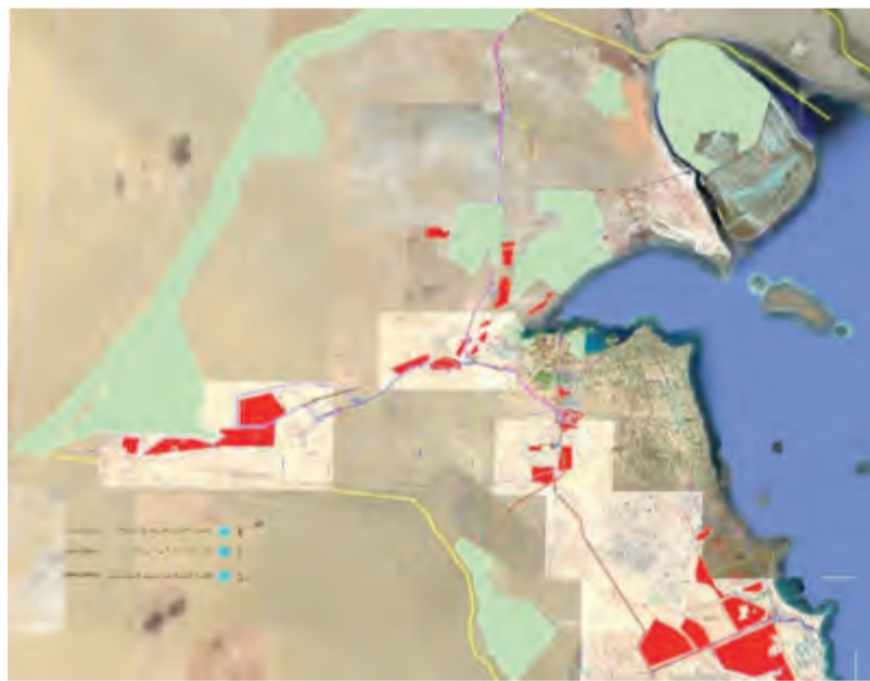
خريطة توضح أماكن التخييم