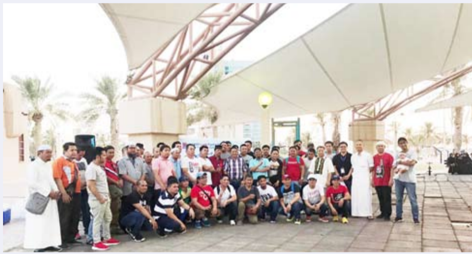
صورة جماعية للمشاركين في الاحتفالية