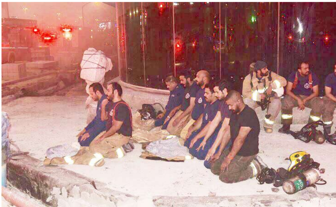
فريق الإطفاء يؤدي الصلاة بعد السيطرة على الحريق