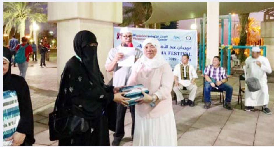
توزيع الهدايا على المهتمين الجدد

الأعمال الصالحة، كما شارك فيها البعض من غير المسلمين والجاليات المسلمة بهدف تحبيب الجميع في الإسلام، حيث تنوعت فعاليات عيد الاضحى المبارك التي اقامتها اللجنة بأفرعها المختلفة بجميع محافظات دولة الكويت للكنار والصغار ما بين الدروس والمحاضرات والمسابقات وتوزيع الهدايا والتعارف واطامة الرحلات للاماكن السياحية والحدائق والاماكن الترفيهية.