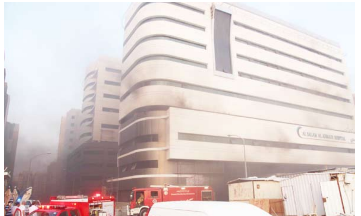
فريق الإطفاء امام المستشفى