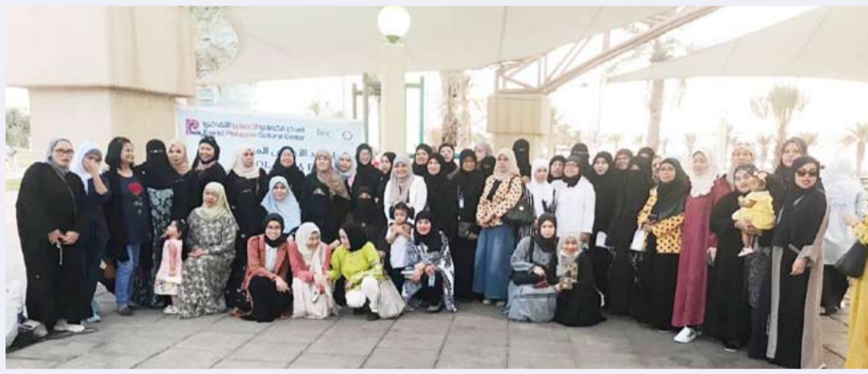
.. وأخرى للمشاركات

والتي كان لها الاثر البالغ بنفوس جميع المشاركين بهذه البرامج رجالاً ونساءً والتي من خلالها قدم المشاركون من ارض الجاليات المقيمة على ارض الكويت الشكر للحكومة الكويتية والى الشعب الكويتي الكريم على حسن التعامل وكرم الضيافة واتت هذه الإشادات من خلال الكلمات التي القاها عدد من المشاركين في البرامج والأنشطة التي اقامتها أفرع اللجنة المختلفة.