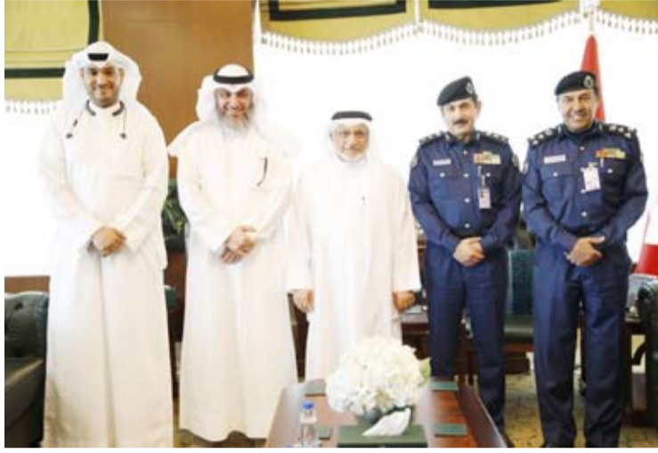
صورة جماعية عقب اللقاء