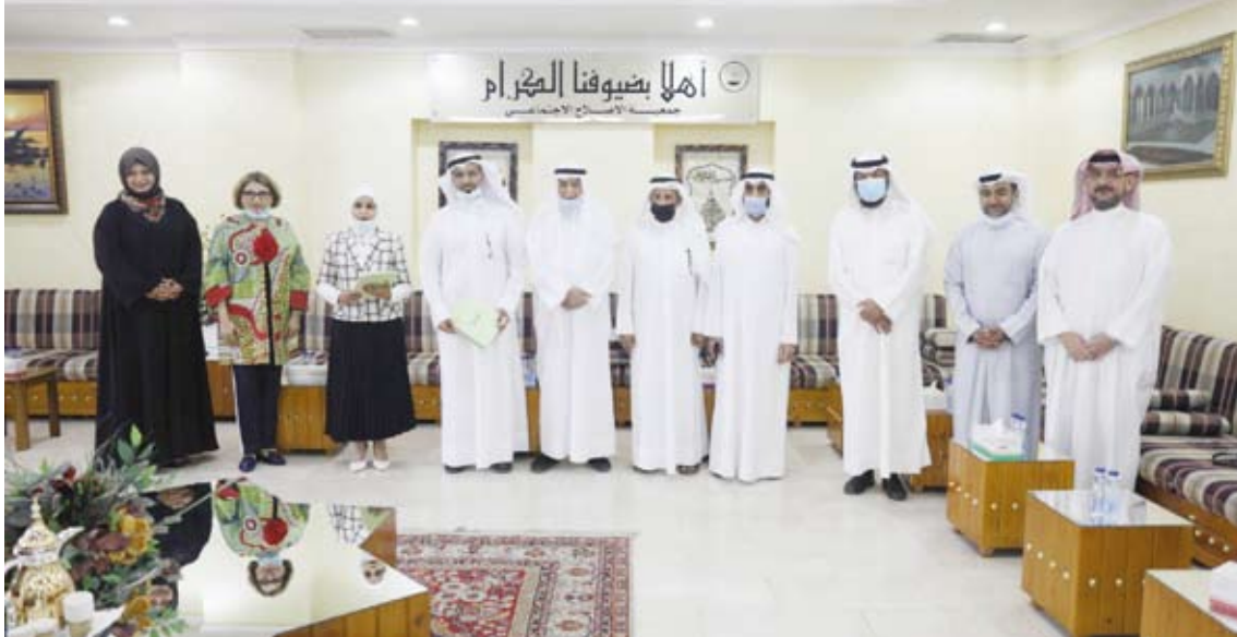
لقطة جماعية للمشاركين في حفل التوقيع