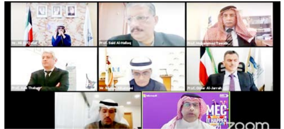
جانب من الاحتفالية الافتراضية