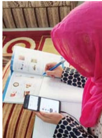
إحدى المشاركات في المشروع

جهوداً حثيثة تجاه تعليم اللغة العربية وقدمت دوراً بارزاً في مجال تنظيم الدورات للمبتدئين الجدد بأفرع اللجنة قبل وأثناء الأزمات وكذلك الإشراف الفني عليها، حيث كان لإدارة الشؤون النسائية إسهامات متميزة في تأسيس مناهج متخصصة للغة العربية، مبنية على أسس منهجية صحيحة ذات بعد تعليمي وأثر بناء في شخصية المنتسبات، بجانب إشراف طواقم مميزة من أهل الخبرة والدراسة ومتخصصين أكفاء على تنفيذ المشروع والذي حظي بدوره بقبول واستحسان شريحة المنتسبين للمشروع. وتقدمت الرياح بشكر الأمانة العامة للأوقاف، مضمّنة دعمها المبارك لجمعية النجاة الخيرية حيال تنفيذ مشروع تعليم اللغة العربية والذي سيكون له انعكاساً إيجابياً على الجاليات غير العربية والمجتمع بشكل عام.