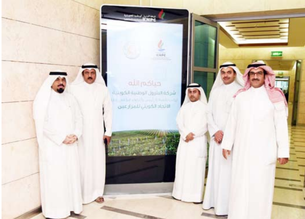
أعضاء مجلس الإدارة أمام لوحة ترحيبية في مقر البترول الوطنية