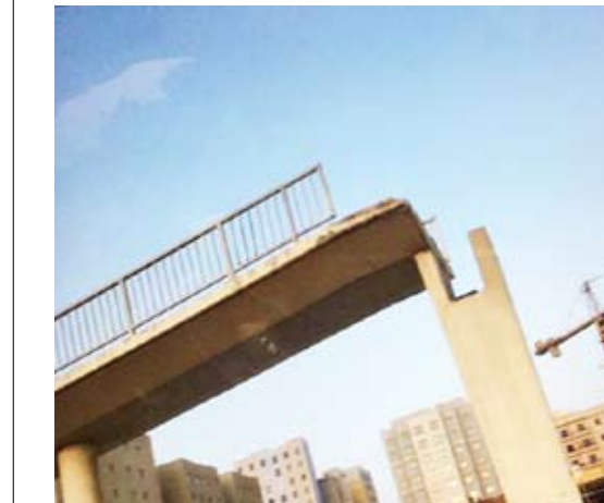
جانب من الجسر المنهار

المشاة مضطرون إلى المخاطرة باجتياز الطريق السريع كما يؤدي إلى حوادث اصطدام نظراً لكثرة التوقف المفاجئ للمركبات أو تهدئة السرعة خلال عبور المشاة. وناشد العتيبي الجهات المعنية في الأشغال وهيئة الطرق إلى الإسراع بانجاز