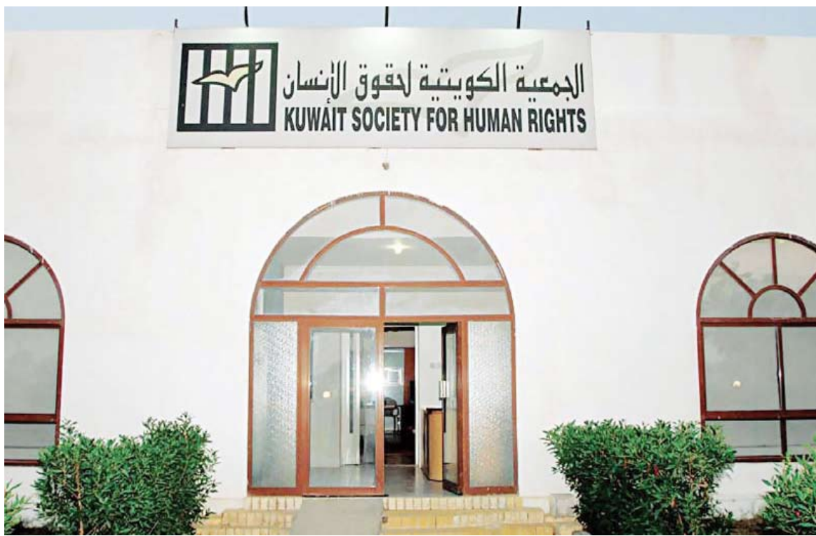
الجمعية الكويتية لحقوق الإنسان

الدينية التي تشكل تحدياً على التمييز والعداء والعنف كما أن الجمعية ستواصل إدانة السخرية من الرسل عليهم السلام لكافة الأديان السماوية. ودعت الجمعية في هذا الشأن المجتمع الدولي وكافة المنظمات الدولية والإقليمية والإسلامية والعربية للضغط على الحكومة الفرنسية لوقف هذه الإساءات لنبي الإسلام محمد صلى الله عليه وسلم، والاعتذار عما أقدم عليه الرئيس الفرنسي من ترويج لخطابات الكراهية في الوقت الذي يعمل به العالم بكل طاقته لوقف مثل هذه الخطابات والحد من انتشارها. وأضافت: لقد أشعلت فرنسا ردود فعل غاضبة في العالم الإسلامي، وعليها أن تعتذر الآن عن تجاوزاتها وجرح مشاعر المسلمين حول العالم. وفي السياق ذاته، أكدت الجمعية أنها تدعم حرية الرأي والتعبير، دون الإساءة والمساس بحقوق الآخرين، إذ أن تصريحات الرئيس الفرنسي إيمانويل ماكرون لا يمكن إدراجها ضمن حرية التعبير عن الرأي بل ضمن استهداف المعتقدات والرموز الدينية، وفي ذلك انتهاكاً لحرية التعبير ونخت واضح لحقوق الآخرين في حماية مشاعرهم الدينية، ويخالف حكم المحكمة الأوروبية لحقوق الإنسان الصادر يوم 25 أكتوبر عام 2018 في قضية إساءة مشابهة، الذي أكد أن على مثل هذه التصريحات هي "تجاوز الحد المسموح به في النقاش وتصنف كهجوم مسيء على رسول الإسلام، كما تعرض السلام الديني للخطر".