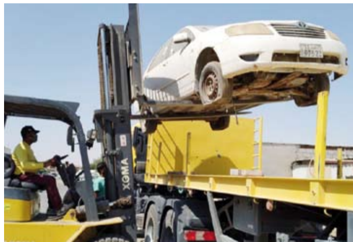
رفع سيارة مهلة