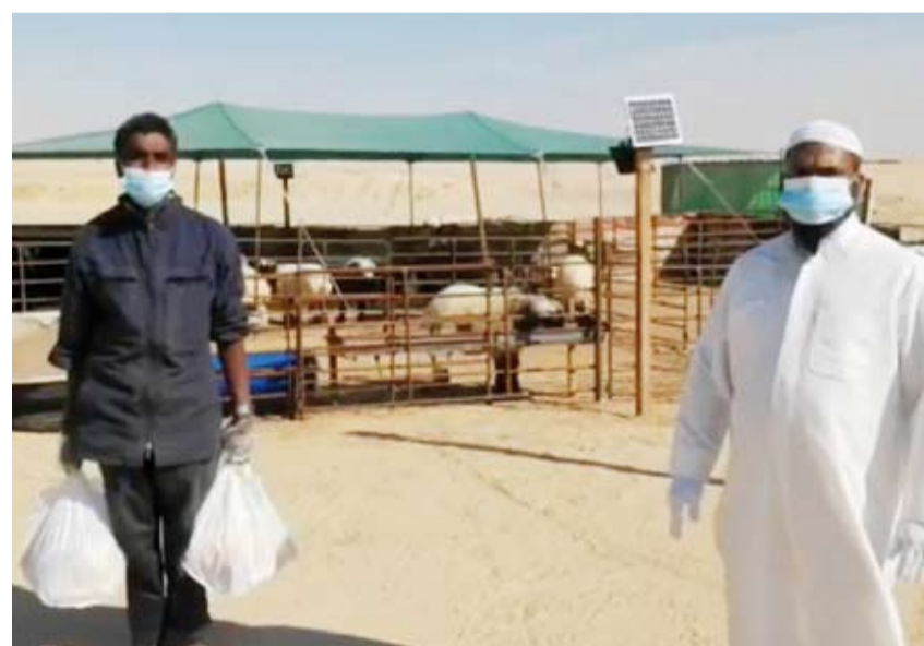
توزيع السلال الغذائية