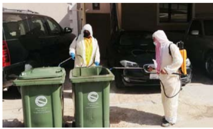
غسيل وتعقيم الحاويات