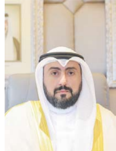
الشيخ الدكتور باسل الصباح

أشاد سفير الاتحاد الأوروبي المعتمد لدى البلاد الدكتور كريستيان تودور بالاجراءات التي قامت بها الكويت في سبيل مواجهة واحتواء جائحة كورونا المستجد (كوفيد19-) والحد من تداعياتها المختلفة.