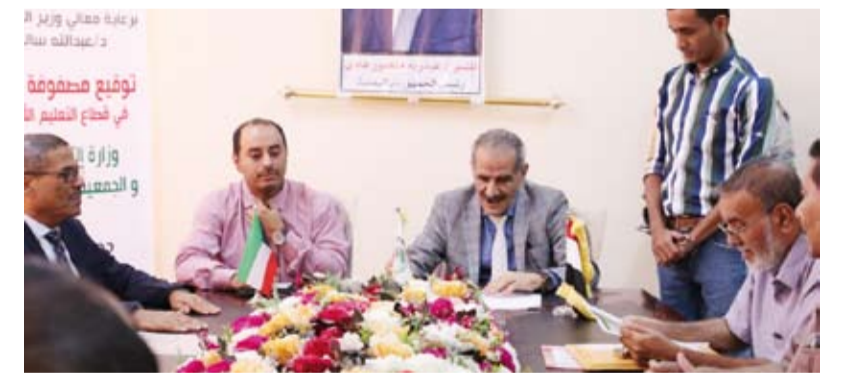
جانب من توقيع الاتفاقية

وقعت الجمعية الكويتية للإغاثة - مكتب اليمن صباح أمس، اتفاقية مع وزارة التربية والتعليم ومطابع الكتاب المدرسي لتوريد 3 وحدات فرز ألوان CTP لطباعة الكتاب المدرسي. وأثناء مراسم التوقيع شكر وزير التربية والتعليم الدكتور عبدالله سالم المس دولة الكويت على عطاها السابق والحالي في دعم قطاع التعليم والعملية التعليمية في اليمن. كما أكد المس بانه من خلال هذا الدعم المقدم لمطابع الكتاب المدرسي والذي يحتوي على أجهزة فرز الألوان الحديثة ستمكن من طباعة الكتاب وبجودة عالية واللوان واضحة. كما أضاف بوجود هذه الأجهزة ستمت طباعة الكتاب المدرسي وبطريقة أسرع من ذي قبل.