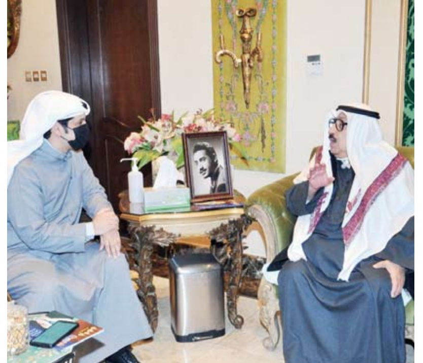
وزير الإعلام أثناء زيارته منزل الفنان القدير عبدالعزيز المرچ

قال وزير الإعلام ووزير الدولة لشؤون الشباب رئيس المجلس الوطني للثقافة والفنون والآداب عبدالرحمن المطيري أمس: إن أعمال الفنان الكويتي القدير عبدالعزيز المرچ (شادي الخليج) أسهمت بتوثيق الفلكلور الشعبي والتراث الكويتي الأصيل. وأضاف المطيري في تصريح صحفي على هامش زيارته منزل الفنان المرچ الذي يرأس مجلس إدارة جمعية الفنانين الفلكلوريين للاطمئنان على حالته الصحية أن المرچ يتمتع بمكانة كبيرة في تاريخ الحركة الفنية الكويتية والخليجية والعربية بفضل الأعمال المميزة التي قدمها على مدى أعوام كثيرة.