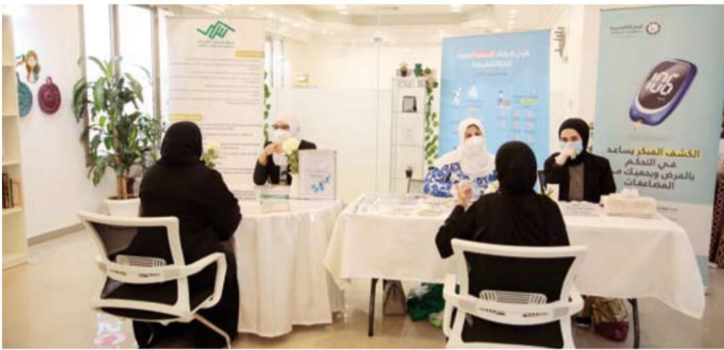
إجراء فحص السكري للمراجعات

لإقامة هذا النشاط الطبي الرائد والذي ساهم بشكل كبير في زيادة التوعية بمخاطر مرض السكر ومضاعفاته وكيفية الوقاية منه، سائلة العلي القدير أن يحفظ الكويت وأهلها والعالم أجمع من كل سوء.