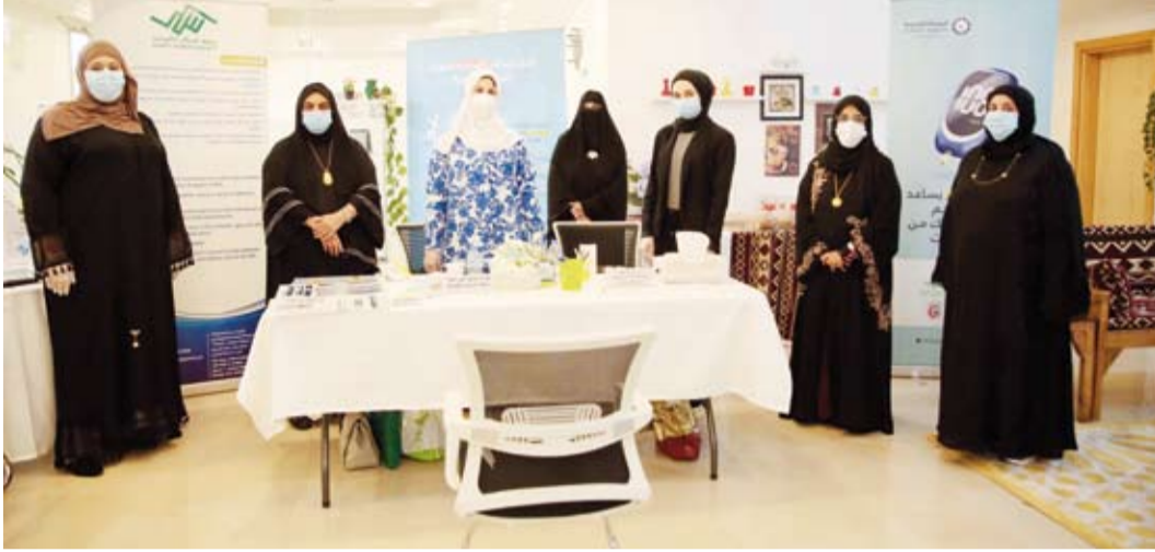
وضحة البليس تتوسط المشاركات