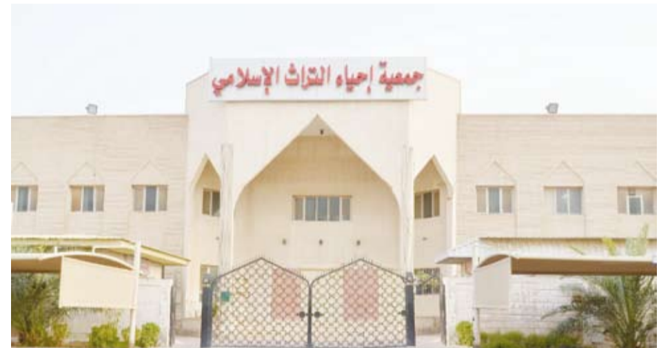
جمعية إحياء التراث الإسلامي

وحول المشاريع التي تقوم بها في دول البلقان أوضحت الجمعية في تقريرها بأنها عملت على تحقيق أهدافها المنشودة في خلق عمل إسلامي خيري متكامل يهدف لنصرة وإغاثة المنكوبين في دول البلقان، والأخذ بأيديهم لتفقيهم بتعاليم دينهم الحنيف، وتذليل السبيل لذلك، وللجمعية مشاريع كثيرة هناك مثل: بناء المساجد والمراكز الإسلامية والمدارس، وذلك لما لها من أهمية قصوى في حياة المسلم. كما أوضحت بأن التبرعات التي يساهم بها أهل الخير ساهمت في قيام مشاريع استفاد منها كثير من المحتاجين في البلقان، فمساهمات أهل الخير ولله الحمد والمنة جعلت المسلمين يشعرون بأن هناك إخواناً لهم يهتمون بأمرهم، وبذلك يكون هناك تكاتف وتآزر وألفة بين المسلمين.