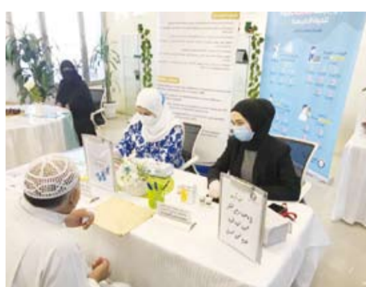
فحص مرضى السكري

تليق بكرامة الإنسان، وحول المشاريع الإنتاجية التي تحققت خلال العام الماضي أجيابت البليس: بفضل الله وتوفيقه تم بدعم أهل الخير نفذنا عدد 192 مشروعاً إنتاجياً في كل من النيجر والبانيا وتنوعت المشاريع حسب طبيعة كل دولة فتم تنفيذ دعم مشروع «مخزن آلي» لإنتاج الخبز والمعجنات والحلويات وهذا يساهم في توفير العديد من فرص العمل للطاقات الشبابية المعطلة للإنسان وتحول المنازل القديمة والإكواخ إلى منازل حديثة