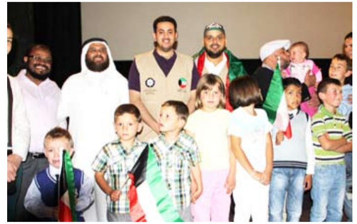
إيتام البوسنة يرفعون اعلام الكويت مع مسؤولي اللجنة

في الجة .. وأشار بإصبعه السبابة والوسطى،) فما أعظم مرافقة رسول الله صلى الله عليه وسلم في الجنة، وهذا إن دل فلنا يدل دلالة واضحة على ذلك. فبينما الحبيب على رعاية الأيتام وحثهم على اعتبار أنهم من شريحة الضعفاء وذوي العوز والحاجة، علاوة على ذلك فإن كفالة الأيتام تزكي مال المسلم وتطهره ويبارك الله فيه أرض الواقع.