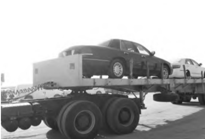
رفع سيارات مهملة