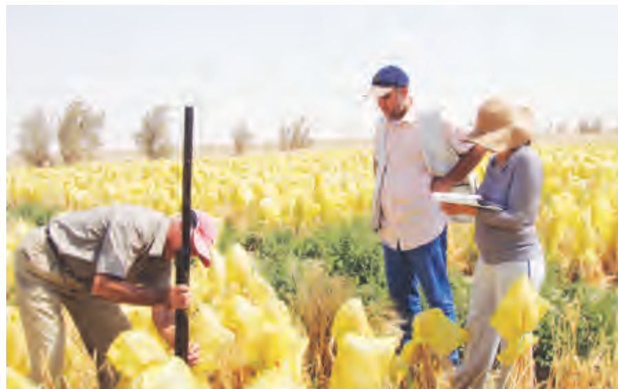
جانب من مساهمات المعهد للحفاظ على الأمن الغذائي

تطوير استراتيجيات وأساليب لتقييم وقياس تدهور النظام البيئي الأرضي واقتراح معايير لاستعادته بالكامل كورشة عمل