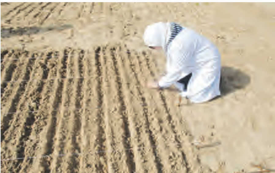
مشروع إنتاج البذور

وأضاف أنه يسعى متفهماً بمرکز أبحاث البيئة والعلوم الحياتية في تحقيق الأمن الغذائي إذ قام المركز بتوجيه جزء كبير من برامجه البحثية لتعزيز هذا المجال وذلك ضمن خطة الاستراتيجية 2015-2020 بالإضافة إلى مشاركته الفعالة في الخطط الوطنية، ودعمه للعديد من مؤسسات الدولة المعنية والمختصة.