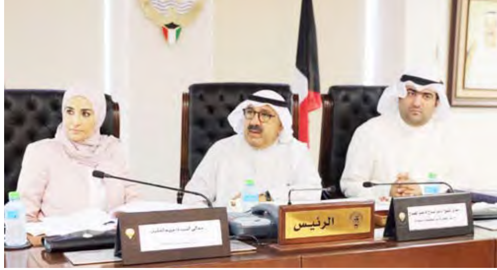
الشيخ ناصر صباح الأحمد يتوسط الروضان والعقيل

ترأس النائب الأول لرئيس مجلس الوزراء وزير الدفاع رئيس المجلس الأعلى للتخطيط والتنمية الشيخ ناصر صباح الأحمد أمس الثلاثاء الاجتماع التاسع للمجلس بحضور وزيرة الدولة للشؤون الاقتصادية مريم العقيل.