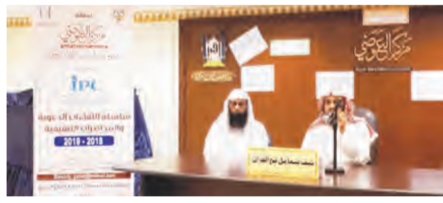
الداعية يلقي المحاضرة

التجويد ومخارج الحروف، مؤكداً العناية بكتاب الله تعالى بحفظ بعض أجزاء القرآن وقصار السور على الأقل، وتدبر معانيه، والدعوة إلى التعامل مع القرآن إتباعاً له وعملاً به ودعوة الناس إلى هدايته والعمل على تشجيع أبنائنا للالتحاق بالحلقات القرآنية؛ لما في ذلك من خدمة للقرآن وعلومه، والفوز بالخيرية التي ذكرها النبي صلى الله عليه وسلم حين قال: خيركم من تعلم القرآن وعلمه.