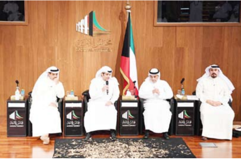
وزير الرياضة أثناء المؤتمر