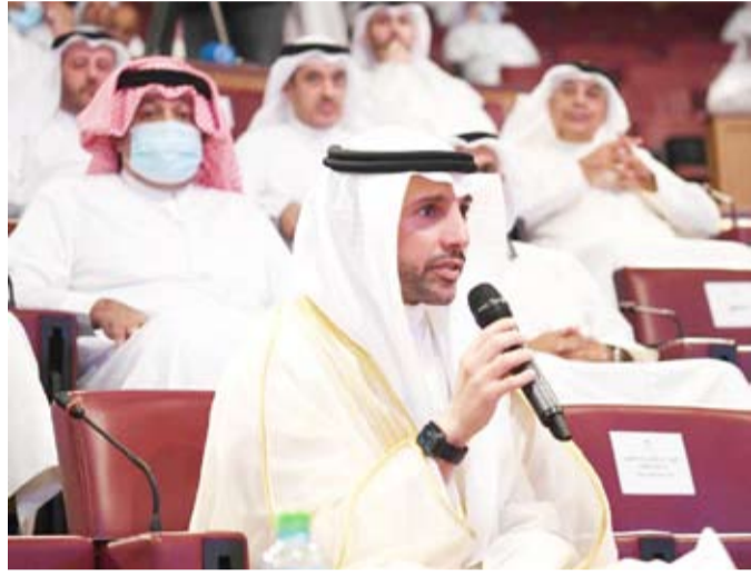
مرزوق الغانم متحدنا