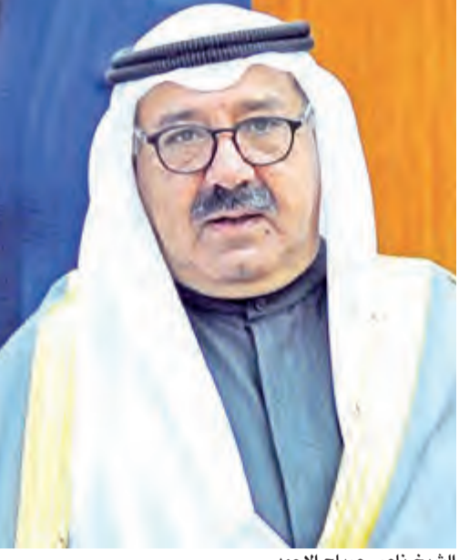
الشيخ ناصر صباح الاحمد

7- وضع آلية لاستقدام العمالة الأجنبية تتيح عدم تأخير طلبات القطاع الخاص في حالة عدم وجود العنصر البشري المحلي المؤهل والمدرّب لتولي وظائف مثل هذه الطلبات. 5- إشراك غرفة التجارة والصناعة والمجالس النوعية في إجراءات المسح وعملية التدريب والتكوير. 6 - ربط شبكات المعلومات فيما يتعلق بالعمالة الوافدة بين وزارة الشؤون الاجتماعية والعمل والإدارة العامة للهجرة. 7 - إعادة النظر في قانون العمل والتشريعات المتعلقة بسوق العمل بما يسمح بتوفير بيئة تنافسية للعامل الكويتي في القطاع الأهلي. 8 - تبني استراتيجية اقتصادية مركزية في قطاعات ذات مردود عالٍ ومرتبطة بتوفير فرص للعمل وربط هذه الاستراتيجية بخطة للتنمية البشرية يشارك في صياغتها القطاع الخاص ومنح المزيد من الحوافز والتسهيلات للقطاع الخاص بما يشجعه ويساعده على المزيد من الاستثمار. 9 - تشجيع قيام المنشآت الصغيرة والمتوسطة والنظر إليها كأحد الخيارات الاستراتيجية لخلق فرص عمل إضافية. 10 - التوسع في طرح فرص ومجالات استثمارية لمشروعات إنتاجية حكومية وخاصة، وجذب الاستثمارات المحلية والأجنبية من