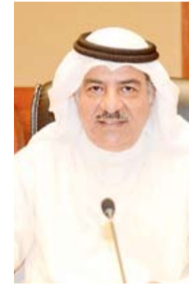
المستشار صلاح المسعد

أعلنت وزارة الصحة الكويتية أمس الأربعاء، تسجيل 814 إصابة جديدة بفيروس كورونا المستجد (كوفيد 19) خلال الـ 24 ساعة قبل الماضية، ليرتفع بذلك إجمالي عدد الحالات المسجلة في البلاد إلى 123,906. في حين تم تسجيل 7 حالات وفاة ليصبح مجموع حالات الوفاة المسجلة حتى أمس 763 حالة. وقال المتحدث الرسمي باسم وزارة الصحة الكويتية الدكتور عبدالله السند لـ (كونا): إن عدد من يتلقى الرعاية الطبية في أقسام العناية المركزة بلغ 107 حالة، ليصبح بذلك المجموع الكلي لجميع الحالات التي ثبتت إصابتها بمرض (كوفيد 19) وما زالت تتلقى الرعاية الطبية اللازمة 8,220 حالة. وأشار السند إلى أن عدد المسحات التي تم القيام بها خلال الـ 24 ساعة الماضية بلغ 7,431 مسحة ليلبيح مجموع الفحوصات 896,986 فحوصات. وحدد الدعوة للمواطنين والمقيمين لمداومة الأخذ بكل سبل الوقاية وتجنب مخالطة الآخرين والحرص على تطبيق إستراتيجية التباعد البدني، موصياً بزيارة الحسابات الرسمية لوزارة الصحة والجهات الرسمية في الدولة للاطلاع على الإرشادات والتوصيات وكل ما من شأنه المساهمة في احتواء انتشار الفيروس. وكانت وزارة الصحة قد أعلنت أمس أيضاً شفاء 807 إصابات خلال الـ 24 ساعة قبل الماضية، ليلبيح مجموع عدد حالات الشفاء 114,923 حالة.