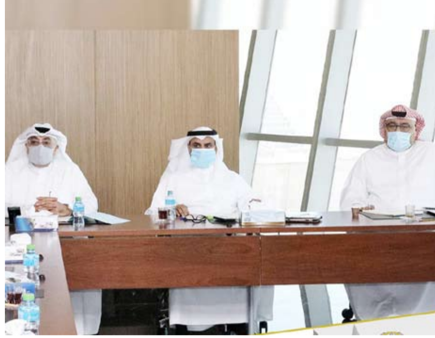
د. سعود الحربي يتوسط السلطان والمقصد خلال الاجتماع

أعلنت وزير التربية الكويتية أمس عن عقد امتحانات ورقية في المدارس لطلبة المرحلة الثانوية (الصفوف 10 و11 و12) مع تحقيق الاشتراطات الوقائية والاحترازية حسب توجيهات وزارة الصحة. وقالت الوزارة في بيان لها: إن وزير التربية ووزير التعليم العالي الدكتور سعود الحربي ترأس اجتماعاً موسعاً مع عدد من المسؤولين بالوزارة أمس، لمناقشة آلية عقد امتحانات نهاية الفصل الدراسي الأول لجميع المراحل التعليمية للسنة الدراسية 2019 - 2020. وذكر البيان أن المجتمعون قرروا عقد امتحانات ورقية في المدارس لطلبة المرحلة الثانوية فقط، وبالمرحلين الابتدائية والمتوسطة