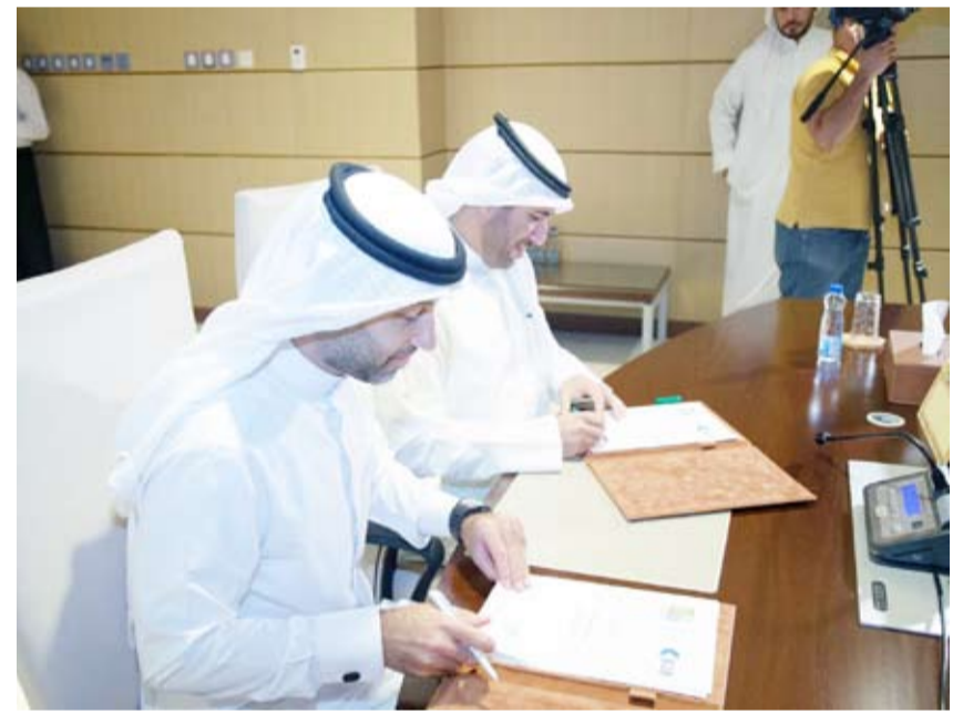
جانب من مراسم توقيع مذكرة التفاهم