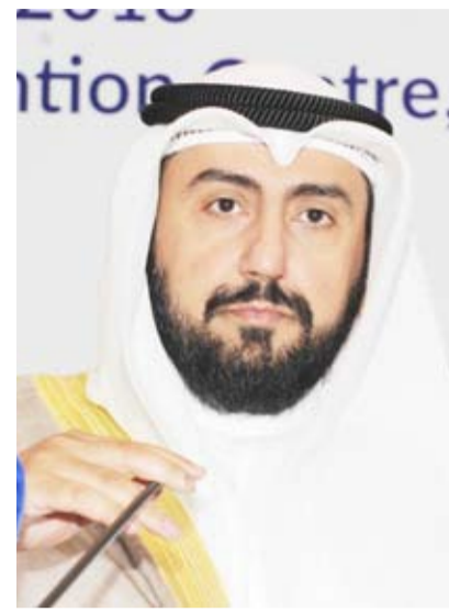
الشيخ الدكتور باسل الصباح

أعلنت وزارة الصحة الكويتية أمس الأحد أن وزير الصحة الشيخ الدكتور باسل الصباح أصدر تعليماته بإحالة قضيتين تتعلقان بوفاة طفل في أحد مراكز طب الأسنان وطفلين في أحد المستشفيات إلى النيابة العامة ومنع المسؤلين عن القضيتين من السفر ومزاولة العمل في البلاد. وقالت الوزارة في بيان صحفي إنه «تم الانتهاء من التحقيق في ملبسات وفاة طفل في مركز لطب الأسنان خلال تلقيه العلاج وإصدار شهادات وفاة لطفلين آخرين عقب حالة إجهاض في أحد المستشفيات قبل التأكد من وفاتها».