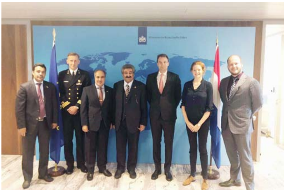
وليد الخبيزي مع مدير إدارة الشرق الأوسط بوزارة الخارجية الهولندية

في مختلف الملفات الثنائية والإقليمية. وأعرب العتيبي في هذا الصدد عن التقدير لدور هولندا ومواقفها من قضايا الشرق الأوسط لاسيما القضية الفلسطينية، وتأكيدا باستمرار التزامها بالقرارات والرجعيات الدولية والالتزام بحل الدولتين كأساس لعلمية السلام. يذكر أن السفير الخبيزي ترأس الجانب الكويتي في المشاورات في حين ترأسها عن الجانب الهولندي مدير إدارة الشرق الأوسط بوزارة الخارجية السفير جيفري فان ليونين وشارك فيها السفير العتيبي ووفدا البلدين.