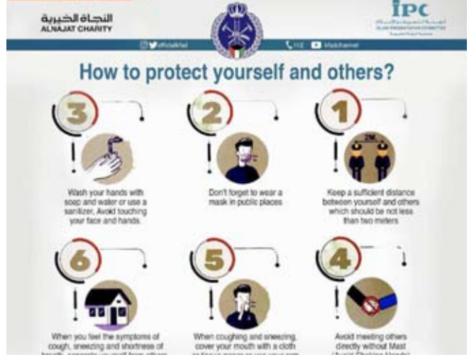
إرشادات باللغة الإنجليزية

بالإسلام والإدارة العامة للإطفاء حيث شاركت اللجنة الإدارة في تقديم العديد من الحملات التوعوية قبل فيروس كورونا.