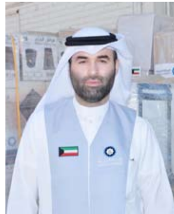
الفونيني يشرف على نقل المساعدات

بجعية إحياء التراث وتنظم دورة أحكام المرأة في الصيام للعلامه صالح الفوزان ينظم القطاع النسائي بجمعية إحياء التراث الإسلامي دورة بعنوان: "مجالس شهر رمضان المبارك.. أحكام المرأة في الصيام"، لفضيلة الشيخ الدكتور صالح الفوزان عضو اللجنة الدائمة للإفتاء وعضو هيئة كبار العلماء من المملكة العربية السعودية، والتي ستكون مخصصة للنساء، وستتضمن 27 درساً يومياً من الأحد إلى الخميس. ويمكن الاشتراك في هذه الدورة التي يشرف عليها لجنة صباح الناصر النسائية التابعة للقطاع من خلال التواصل على رقم اللجنة في الواتساب. والجدير بالذكر أن جمعية إحياء التراث الإسلامي استمرت رغم ظروف جائحة كورونا في عملها الدعوي من خلال الأون لاين وغير برامج التواصل في تنظيم العديد من الدورات والندوات وحلقات التحفيظ، وحرصت فيها على استضافة العلماء والمشايخ أصحاب العلم الشرعي الصحيح للاستفادة بأكثر قدر ممكن من علمهم، واستغلالاً للوقت فيما هو نافع ومفيد.