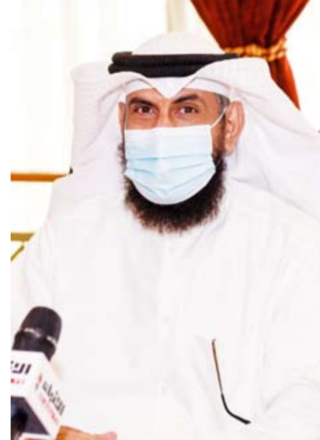
د. مشعان العتيبي

أكد وزير الكهرباء والماء والطاقة المتجددة ووزير الشؤون الاجتماعية والعمل والتنمية المجتمعية، الدكتور مشعان العتيبي، حرص الحكومة على دعم العمل التعاوني الذي "يعتبر من نماذج الناجحة على مستوى العالم". وقال العتيبي في تصريح للصحافيين أمس على هامش زيارة قام بها إلى اتحاد الجمعيات التعاونية: إن الحكومة تثمن دور الاتحاد ودور الجمعيات في تلبية احتياجات المجتمع من سلع و مواد أساسية، الأمر الذي حقق الأمن الغذائي بكافة أشكاله بالتعاون مع كافة الجهات الحكومية المعنية خلال هذه الفترة. ونوه بدور الجمعيات التعاونية وأهمية المحافظة على رسالتها الأساسية والمجتمعية بتقديم المنتجات والسلع بأسعار تنافسية وجودة عالية للمواطنين والمقيمين، مبيّناً أن للجمعيات التعاونية دوراً وطنياً مشهوداً خلال الأزمات التي مرت بها البلاد. وأكد أنه سيتم تقديم الدعم اللازم سواء من الناحية التشريعية أو الإدارية لكي تمارس الجمعيات دورها بكل شفافية لتحقيق المزيد من النجاح. ومن جهته قال رئيس اتحاد الجمعيات فهد الكشفي في تصريح مماثل: إن الاتحاد قام من جانبه بتقديم عدة اقتراحات وقوانين تخص العمل التعاوني، منوهاً بالدور الذي اضطلع به الجمعيات خلال جائحة "كورونا"، فضلاً عن دعمها للمنتجات الوطنية. وشدد الكشفي على أن الجمعيات التعاونية أتمت استعداداتها لشهر رمضان المبارك المقبل، مؤكداً أن المخزون الغذائي "ممتاز" وأن السلع بكافة أنواعها متوفرة.