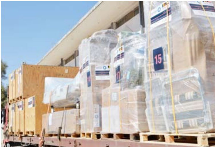
إحدى شاحنات المساعدة في طريقها إلى القاعدة الجوية