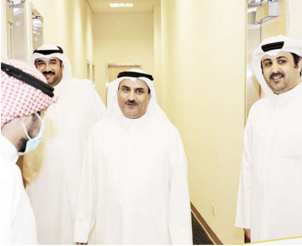
جانب من الجولة التفقدية