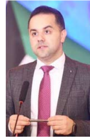
د. عبد الله السند

الطبية في أقسام العناية المركزة بلغ 118 حالة ليصبح بذلك المجموع الكلي لجميع الحالات التي ثبتت إصابتها بمرض (كوفيد-19) وما زالت تتلقى الرعاية الطبية اللازمة 7898 حالة. وأشار إلى أن عدد المسحات التي تم القيام بها خلال 24 ساعة الماضية بلغ 4147 مسحة ليبلغ مجموع