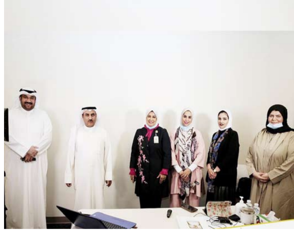
د. سعود الحربي يتطلع على عملية تسجيل المواد التعليمية

تفقد وزير التربية ووزير التعليم العالي الدكتور سعود الحربي أمس الخميس استوديوهات المنصة التعليمية والاستعدادات لتصوير الحلقات العلمية للعام الدراسي الجديد 2021/2020.