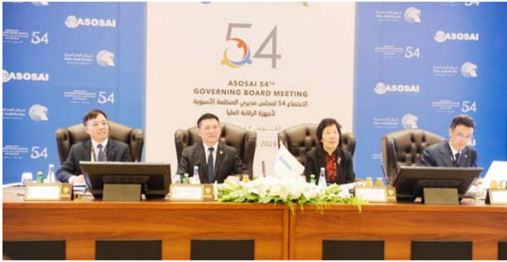
جانب من الاجتماعات

سعي (الأسوساي) دانثما إلى الحصول على حلول تؤدي لنتائج فعالة في مجال الرقابة المالية والمستدامة مشيراً إلى أن الاجتماع سيناقش على مدى يومين موضوع إدارة التخطيط الاستراتيجي وتطوير الخطة الاستراتيجية للمنظمة. وذكر أن (الأسوساي) بالتعاون مع (الإنثوساي) والمنظمات الإقليمية الأخرى تهدف إلى تعزيز تبادل الخبرات وتعزيز الإجراءات والمعايير والاهتمام بتدريب مدققي الأجهزة الرقابية. وبين أن نجاح هذا الاجتماع ثمره التعاون المستمر والبناء لأعضاء (الأسوساي) ومساهمتهم منوهاً بأن استضافة الكويت الثرية وبهجيتها الثقافية لهذا الحدث تعتبر أحد العوامل التي تساهم في نجاح أعماله. وأسست (الأسوساي) عام 1978 من 11 عضواً وتمثل عضويتها في الأعضاء الموقعين على ميثاقها وعلى أعضاء كاملي العضوية وأعضاء منتسبين في حين ارتفع عدد الأعضاء ليلعب 46 جهازاً أعلى للرقابة المالية والمحاسبة. وتمثل أهداف (الأسوساي) في تعزيز التفاهم والتعاون بين أجهزة تها من خلال تبادل الأفكار والخبرات في مجال الرقابة المالية وتوفير إمكانيات متنوعة في مجال التدريب والتكوين المستمر للمراجعين الماليين العاملين من أجل تحسين جودة الرقابة المالية والأداء. ومن أهداف المنظمة كذلك القيام بنشاطات مركز للمعلومات وحلقة تواصل في مجال الرقابة المالية مع أجهزة وهيئات في أنحاء العالم الأخرى وتعزيز وتكثيف التعاون بين المراجعين الماليين العاملين بالأجهزة الأعضاء وذلك بين المجموعات الإقليمية.