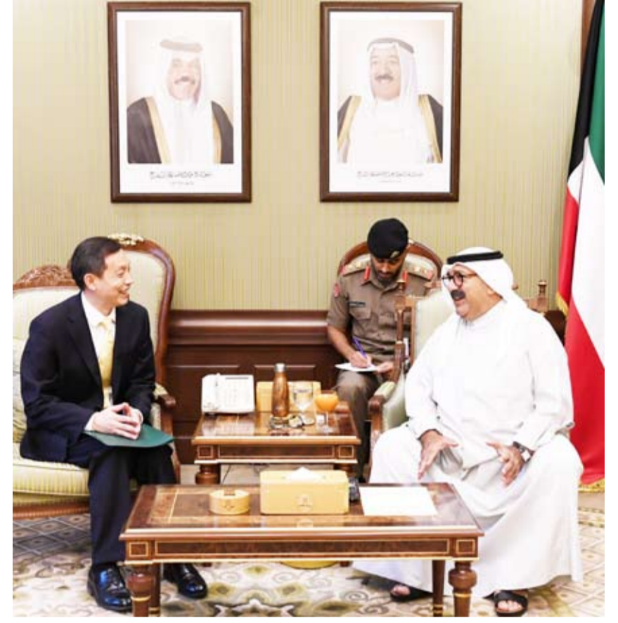
النائب الأول لرئيس مجلس الوزراء ووزير الدفاع الشيخ ناصر صباح الأحمد الصباح مستقبلاً السفير الصيني

استقبل النائب الأول لرئيس مجلس الوزراء ووزير الدفاع الشيخ ناصر صباح الأحمد الصباح بقصر بيان العامر صباح أمس سفير جمهورية الصين الشعبية بين البلدين الصديقين وحرص الطرفين على تعزيزها وتطويرها . حضر اللقاء المحقق العسكري لجمهورية الصين الشعبية الصديقة العميد تشانغ قه . الصادقة لدى البلاد لى مينغ قانغ . و تم خلال اللقاء تبادل الأحاديث الودية ومناقشة أهم الأمور والموضوعات ذات الاهتمام المشترك ، مشيداً بعمق العلاقات الثنائية