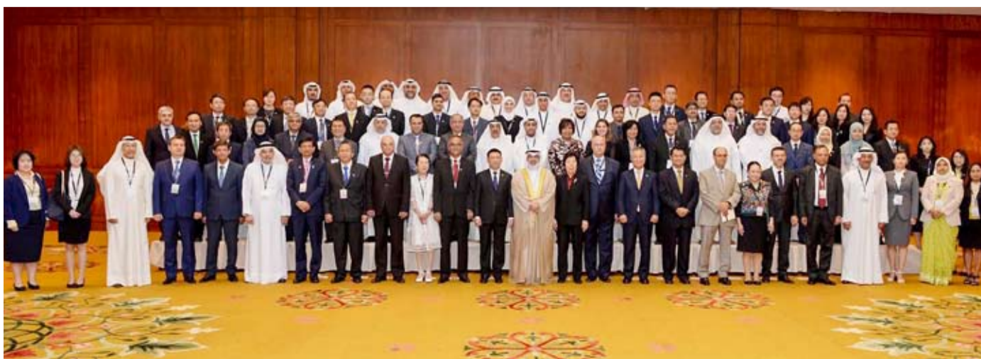
الأجهزة المشاركة في صورة جماعية

مرحلة العمل في اكتوبر المقبل وكذلك التشديد على مخالفات السلامة الخاصة بانقراض البناء ولائحة تشوين بناء السكن الخاص وفك التشابك بين البلدية وهيئة الغذاء ونظام الارشيف الالكتروني للملفات ادارتي التراخيص الهندسية والسلامة في كل فرع. واكد الوزير الشعلة عزمه القيام بزيارات اخرى للوقوف على سير العمل و آلية انجاز المعاملات وتكريم الموظفين المميزين في أداء عملهم وتسهيل وتبسيط اجراءات معاملات المراجعين والارتقاء بمستوى أداء الخدمات المقدمة. وشدد على رفع كفاءة الارشيف الخاص بنظام حفظالملفات فيما يتعلق بإدارتي التراخيص الهندسية والسلامة من خلال آلية عمل السجل العام الخاص بكل فرع. واكد الشعلة الحرص على