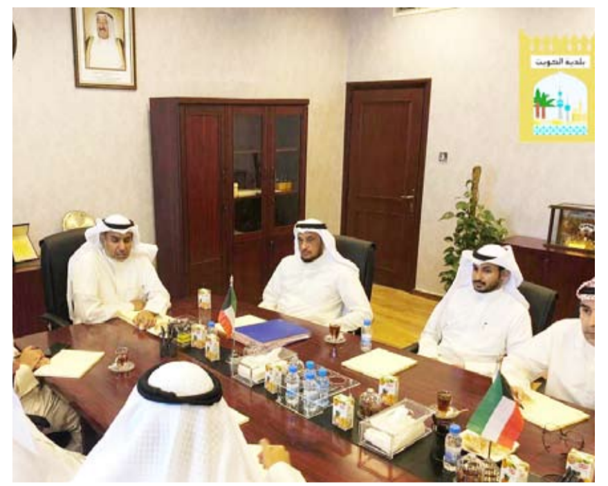
... وانشاء اجتماعه بموظفي فرع الجبراء

اعلن وزير الأوقاف والشؤون الإسلامية ووزير الدولة لشؤون البلدية فهد الشعلة أن البلدية ستضع نظام تصنيف لأفضل فرع في المحافظات طبقاً لمعايير فنية تتعلق في العمل البلدي لتكريم الفرع المتميز ، مشدداً على تطوير آلية انجاز المعاملات والارتقاء بمستوى أداء الخدمات المقدمة للمواطنين. وعقد الوزير الشعلة أكثر من اجتماع مع مسؤولي كل فرع خلال زيارة تفقدية قام بها (امس) لفرع البلدية في محافظتي الجبراء والفروانية للاطلاع على عملية سير العمل في الفرع والوقوف على العقبات بهدف تذليلها لتحسين ورفع كفاءة أداء الإدارات المختلفة. ناقش انشاء عدة مواضيع من اهمها ضرورة الاستعداد المسبق من خلال متابعة عقود النظافة الجديدة تمهيداً لدخولها