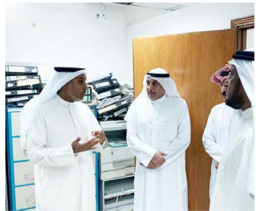
الشعلة في جولة تفقدية على فرع الفروانية