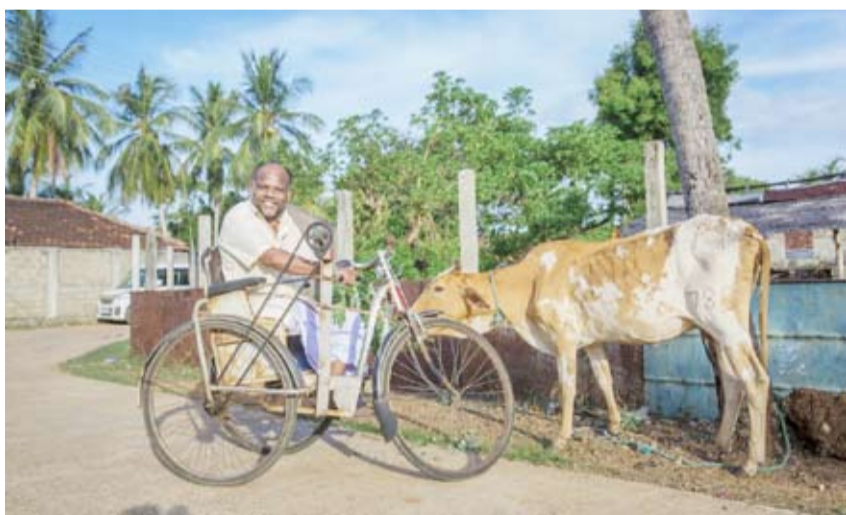
أحد المستفيدين من المشروع

تماشيا مع دورها التنموي الرائد والذي تسعى من خلاله إلى مكافحة الفقر وتوفير فرص العمل واستثمار الطاقات الشبابية المحملة بالمساهمة الفاعلة في تحريك عجلة التنمية بالدول الفقيرة وتحسين واقع مئات الأسر، وزعت جمعية النجاة الخيرية عدد 105 بقرة حلوب خلال عام 2020 استفاد منها 1000 شخص في سيرلانكا. وأوضح عضو مجلس الإدارة بجمعية النجاة الخيرية الدكتور إبراهيم العدساني أن النجاة الخيرية تطمح من خلال هذا المشروع إلى تأهيل الأسر الفقيرة ومساعدتها في توفير متطلبات حياتها بعزّة وكرامة عوضاً عن الانتظار في طابور المساعدات الطويل، معتبراً هذا المشروع يتوافق مع أهداف الأمم المتحدة الطامحة نحو مكافحة الفقر وتوفير فرص العمل للأسر الفقيرة. وتابع: تبلغ تكلفة مشروع وقال العدساني: من خلال خبرتنا الطويلة في العمل الخيري خلصنا أن تنفيذ المشاريع الإنتاجية أحد أهم الحلول الأساسية للقضاء على الفقر، فمهما قدمنا من مساعدات للأسر هذه المساعدات تنتهي أساساً من خلال إعطاء الأسرة مشروعاً إنتاجياً يتناسب معها فإنه يساهم بشكل فعال في مكافحة البطالة وتوفير فرص العمل وتحسين واقع كثير من الأسر ونقلها من الانتظار في طابور المساعدات الطويل إلى ميدان الإنتاج والعطاء والعمل والعزّة والكرامة وهذا ما تدعمه الجمعية بقوة. وختم العدساني بحديث النبي صل الله عليه وسلم قال: من منح منيحة لبن أو ورق أو هدى رقاقاً كمن اعتق رقبته، هذا لمن يهدي شاة تكون مكافأته عتق رقبة، فكيف بمن يقدم بقرة تستفيد منها أسرة بكامل أفرادها، وتاكل من ورائها. المشروع يتوافق مع أهداف الأمم المتحدة في مكافحة الفقر العدساني: المشروع يتوافق مع أهداف الأمم المتحدة في مكافحة الفقر