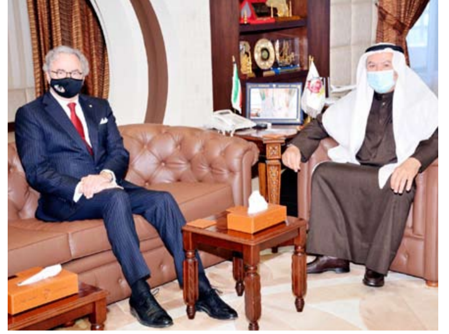
محافظ مبارك الكبير مستقبلاً السفير البلجيكي

وأعرب محافظ مبارك الكبير اللواء م بوشهري، للسفير البلجيكي عن تمنياته للسفير بالتوفيق والنجاح للدفع بعلاقات الصداقة بين البلدين إلى آفاق أرحب. من جهته عبر السفير بيزتر عن سعادته وامتنانه لحفاوة استقبال اللواء بوشهري، معرباً عن التقدير البالغ للرعاية التي تحظى بها البعثة الدبلوماسية لبلايه ومواطني مملكة بلجيكا على الصعيدين الرسمي والشعبي في دولة الكويت.