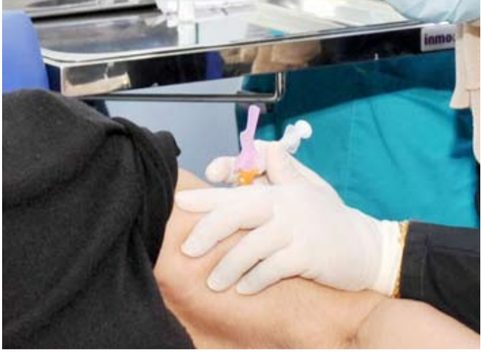
جانب من حملة التطعيم