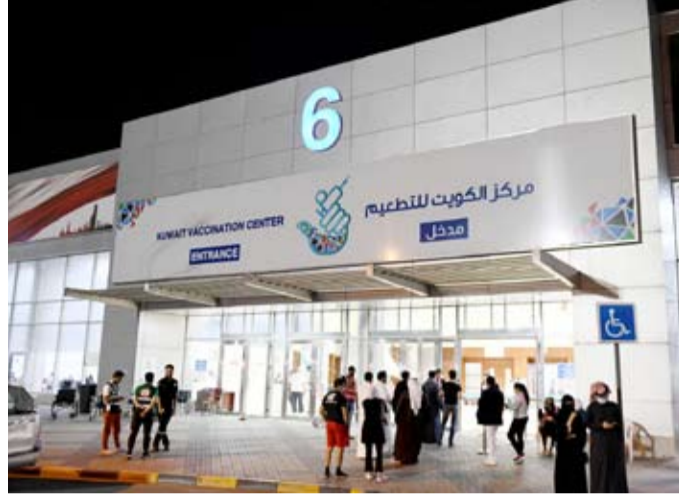
مركز الكويت للتطعيم

للجيش الأبيض في وزارة الصحة وبقية جهات الدولة من الدفاع المدني وجمعية الهلال الأحمر الكويتية ورجال وزارة الداخلية في الإشراف على عملية التطعيم منذ حجز المواعيد إلكترونياً مروراً بتلقي التطعيم وصولاً بإذن الله إلى الغاية في ضمان الصحة العامة وسلامة المجتمع والتخلص من هذا الوباء العالمي.