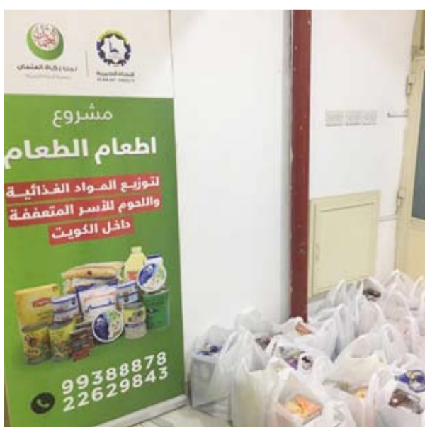
مشروع اطعام الطعام

الفترة الأخيرة ازدياد كبيراً في عدد الأسر التي تأتي طلباً للمساعدة وذلك نظراً للظروف الصحية التي يشهدها العالم كله جراء فيروس كورونا المستجد، وبدورنا نعمل بكل الوسائل المتاحة لنا لتغطية أكبر عدد من الحالات المستحقة.