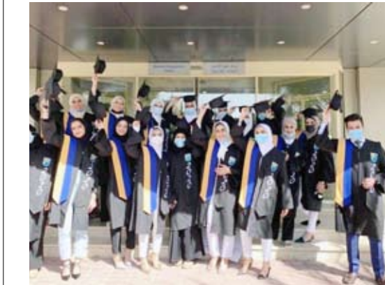
لقطة جماعية للخريجين

قدم عميد كلية طب الأسنان في جامعة الكويت د. عادل العصفور خالص تهنائه لخريجي الدفعة السادسة عشر من طلبة الكلية للعام الجامعي 2019 / 2020 و دوبيهم، وأعرب عن سروره بتخرجهم بنجاح وحصولهم على الشهادة الجامعية رغم الظروف الصحية غير الاعتيادية، متمنياً لهم مستقبلًا باهرًا وأن يكونوا إضافة قيمة في مجال الرعاية الصحية.