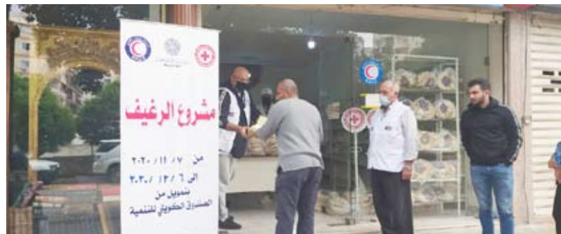
جانب من توزيع المساعدات

بدأت جمعية الهلال الأحمر الكويتي أمس، حملة توزيع مساعدات إنسانية مقدمة من الصندوق الكويتي للتنمية الاقتصادية العربية لدعم اللاجئين السوريين في مختلف المناطق اللبنانية.