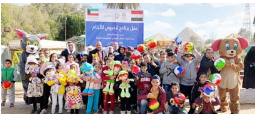
أنشطة ترفيهية لأيتام قبل جائحة كورونا