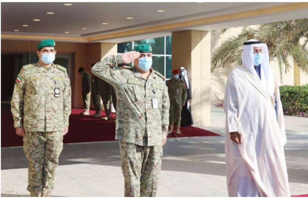
الشيخ أحمد النواف خلال زيارته الرئاسة العامة للحرس الوطني