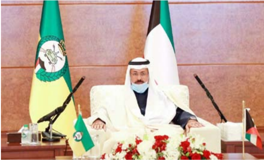
نائب رئيس الحرس الوطني الفريق أول متقاعد الشيخ أحمد النواف متحدثاً